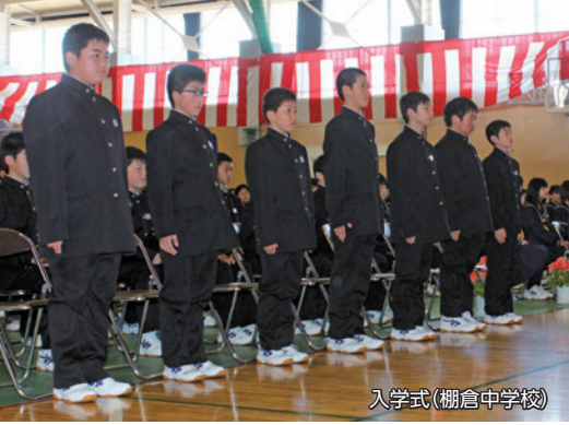
入学式(棚倉中学校)