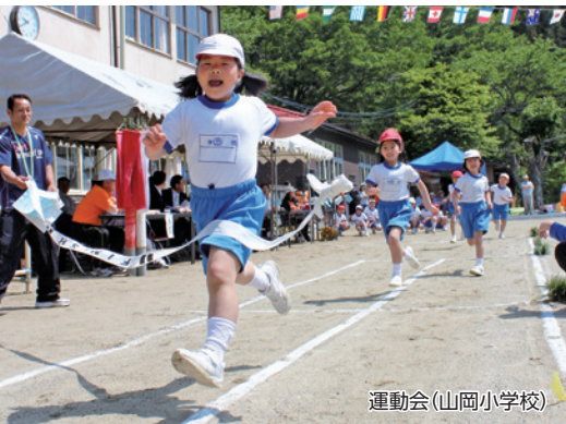
運動会(山岡小学校)