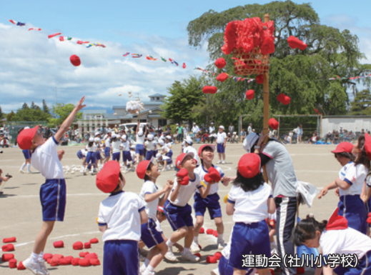
運動会(社川小学校)

固定資産税…1期、全期前納 軽自動車税…全期 上下水道料金…5月例月分 国民年金…4月分