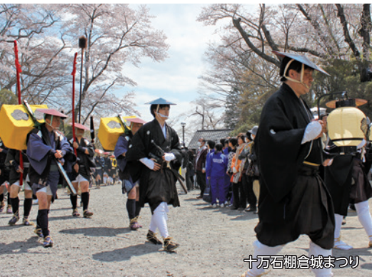
十万石棚倉城まつり