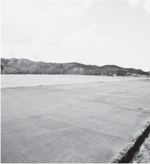
舘ヶ丘地内東洋シャフト社有地