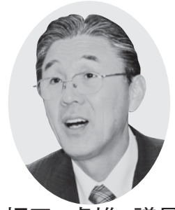
蛭田 卓雄 議員