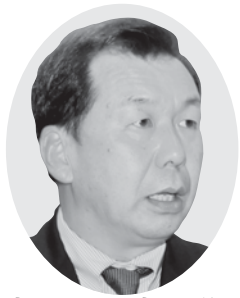
宮川 政夫 議員