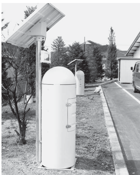
放射線24時間測定中（福祉センター駐車場）

現段階においては不確定要素が多いということから、すぐ出来ないが、今後長引く中で状況の変化によっては、当然対応していきたい。