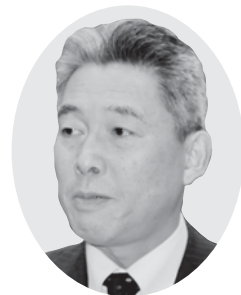
大相 守 議員