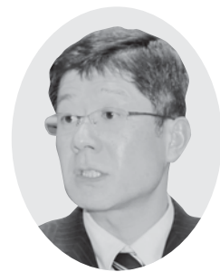
佐川 裕一 議員