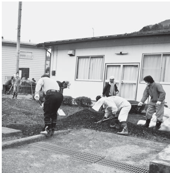
大梅集会所での除染活動