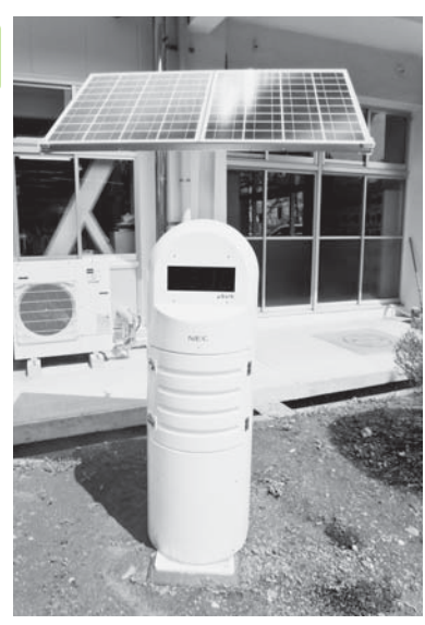
棚倉中学校に設置したリアルタイム線量測定システム

質問 除染計画の具体的な計画は、どの様に進んでいるか。内部被ばくの検査の実施や、小・中学校授業での放射線学習などの予定は。