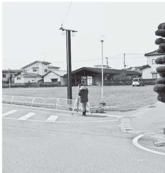
社会教育複合施設建設予定地（棚倉駅前）

質問 予算編成時に当然無理とは思いますが、情報を収集しながら議員を参加すべきと認識するが、いかがか。