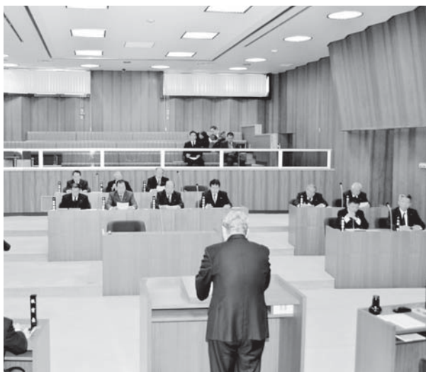
平成23年12月定例議会