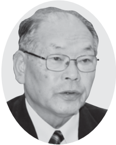
鈴木 政夫 議員