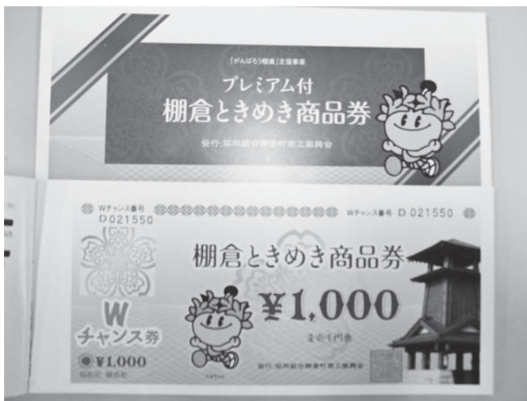
今回発行されたプレミアム付商品券