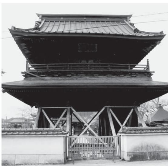
震災により被災した蓮家寺山門

(4)これまでは専門家への調査を依頼するなど支援をしているが、今後山門の解体復元が予定されているようなので、どのような支援ができるかを検討。