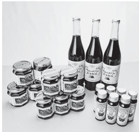
町補助による6次化商品

質問 平成二十三年十五号台風による災害復旧改修工事については、寺山下山本、八槻地区に関わる工事であり、完成時期、国県補助率、地元負担額並びに仮設工事対策について、併せて坊ノ内堰に対する当局の所見を問う。