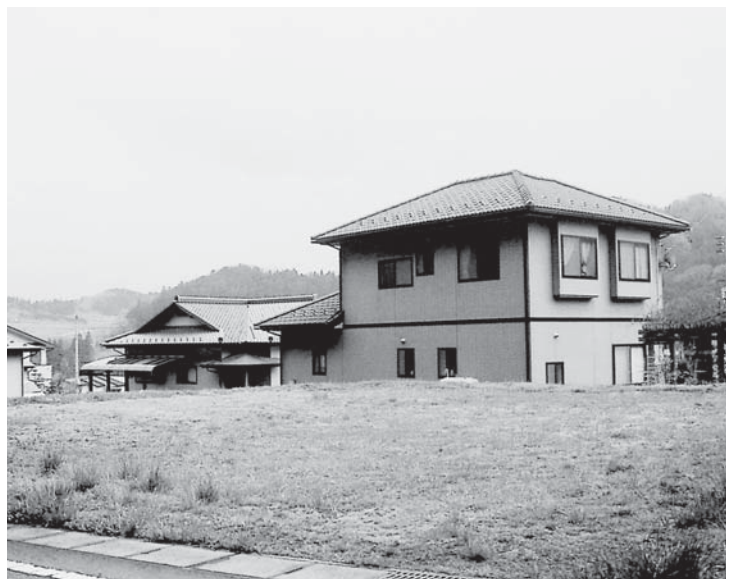
日向前ニュータウン地内

(2)今後とも対策協議会を中心とした要望活動を行い、見直しを求め (3)協同組合棚倉町商工振興会へ一千万円の補助金を支出し、プレミアム付商品券を発行し、町内商工業者の活性化を図る。