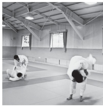
4月から授業で取り組む柔道