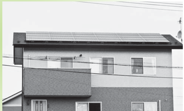
民家に設置された太陽光パネル

平成22年度から 1kwあたり3万円、最大4kw 12万円を限度として 補助金を交付。 平成23年度補助件数29件