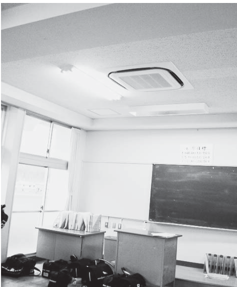
すべての教室に設置されたエアコン

質問 棚倉町復興ビジョン、除染計画を質す。 (1) 除去土壌等の仮置き場候補地は、地元住民の合意を前提とせよ。 (2) 社会教育複合施設建設に復興交付金等を充当できないのか。 (3) 国へ要望していた十八歳以下の医療費無料化が、福島県で実施を検討している。工程と補助額を示せ。 (4) 教室へのエアコンが設置されたので授業時間の拡充を図るべき。