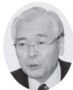
松本 英一 議員