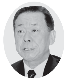
須藤 俊一 議員