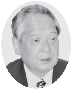
古市 泰久 議員