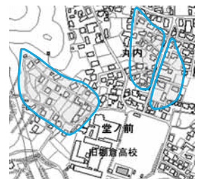
▲丸内・堂ノ前地内