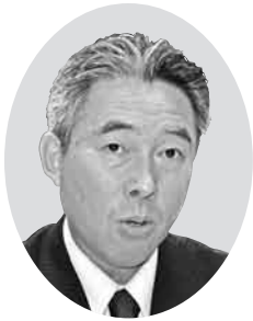
大相 守 議員