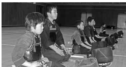
正座で話を聞く子どもたち