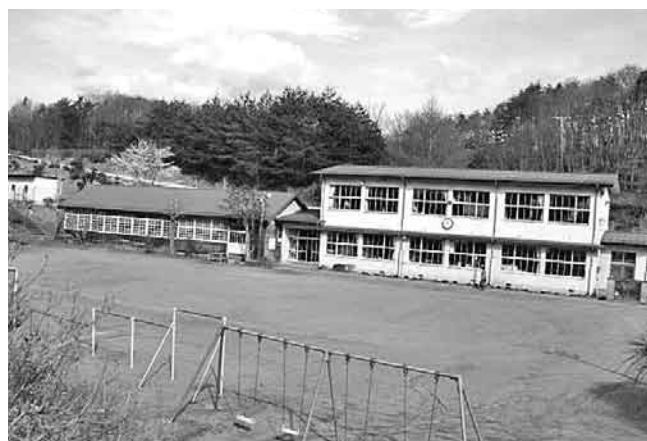
山岡小学校の統合は

検討委員会の提言に基づき統合に向けて検討すると判断をしたが、過去三回の懇談会にお