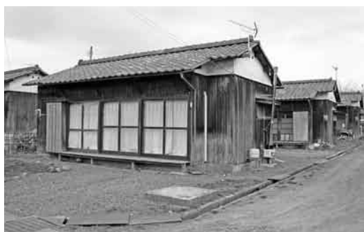
耐用年数が過ぎた町営住宅

町が管理する町営住宅は、現在二百三十戸。まず、本町における現状と課題を明らかにし、公営住宅ストック総合利用計画により住宅政策を定め、修繕計画や建替え新設等も合わせて、今後の振興計画、実施計画に反映させたい。