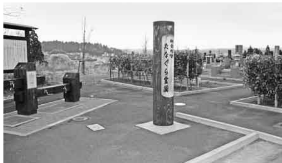
全区画契約となった霊園事業

霊園整備は平成三十三年度より、合計二百三十区画を整備し、現在全区画契約済み。収入の永代使用料、