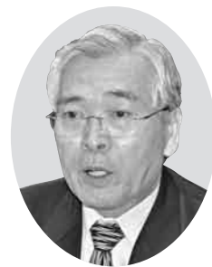
松本 英一 議員