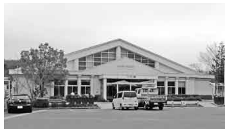
活性化が期待されるルネサンス棚倉