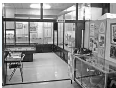
中央公民館三階にある資料館