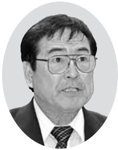
和知 良則 議員