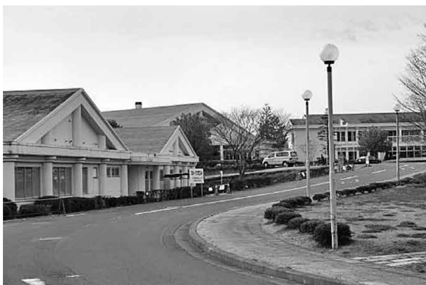
経営改善に取り組むルネサンス棚倉

定年は、営業課長は六十歳、取締役は会社の定款で二年ごとの任期と株主総会で一応決定しているが、実際には役員の定年は六十五歳という決めがあるので、営業成績が良くて、しっかり行つてもらえれば六十五歳まで勤めて頂くこともある。