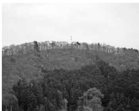
1月に地デジ開局の富岡中継局

年間三百人程度が来場。三年間のみ展示であるため、今年三月で閉館する。新たに展示場を開館するかは検討中。