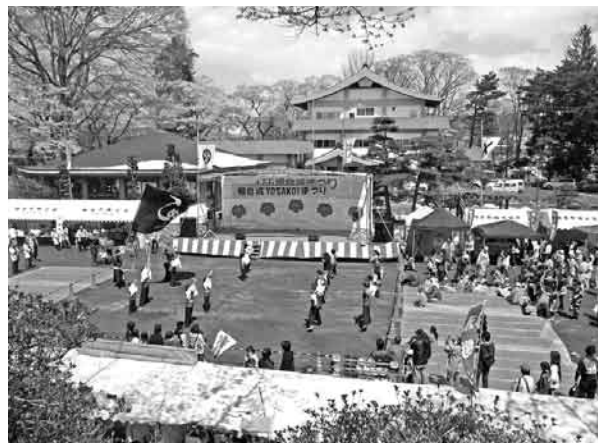
にぎわいをみせた十万石棚倉城まつり