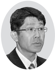
佐川 裕一 議員