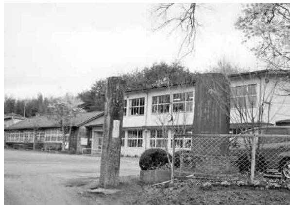
山岡小学校の統合は