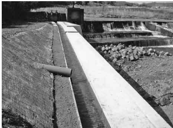
用水路が被災し改修された寺山堰下流水路