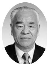
前副議長 鈴木 理義