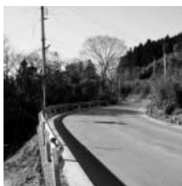
カーブの多い薬師堂-高瀬区間

町長 県南建設事務所との平成27年度の事業調整会議の中で、当該区間の線形改良について要望しており、その後の状況については現地の状況を確認し対応方法について検討するとの回答なので今後も引き続き要望していく。 課長 詳細の回答は、来年の月上旬に県南建設事務所から町長に報告があるので、状況を踏まえた後に再度要望していきたい。