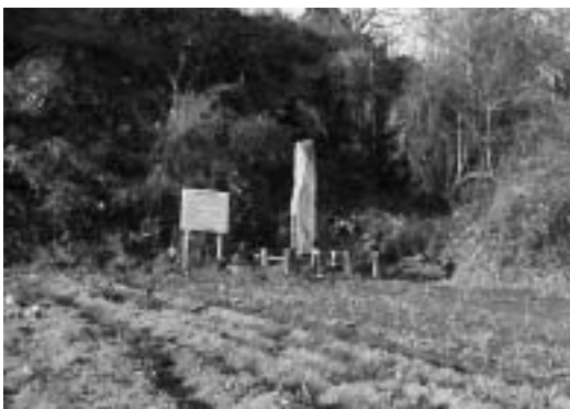
玉室和尚の草庵跡の碑

問 石碑に向かう上がり口の排水路の整備を考えられないか。現在のところ整備は考えていない。 町長 今後、内容を検討しながら対応していきたい。