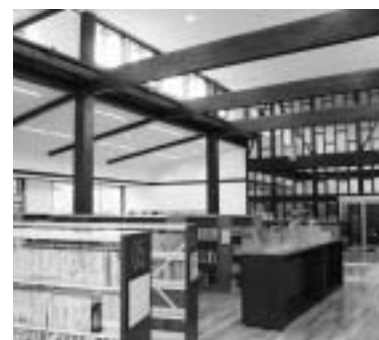
木の温もりが際立つ図書館内部

問 実績と今後の方向性は。 町長 ルネサンス棚倉のホテルの床、ホール、棚倉幼稚園舎、図書館等に使用している。今後も引き続き利用し、木造化、木質化を推進する。