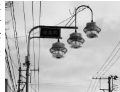
老朽化の進む街路灯

町長 街路灯の電気料の半分を町が負担しているが、所有が個人や管理組合など様々なので老朽化による更新については状況に応じた対応が必要である。街路灯を自ら撤去しての防犯灯の設置は、事例もあり可能である。