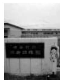
棚倉町立 棚倉幼稚園

答 応募は32名(定員25名)キャリア教育を意欲し子育て支援事業に沿って現場の教職員、さらに保護者の意見も踏まえ他町村の事例も参考にしながら期待に応えたい