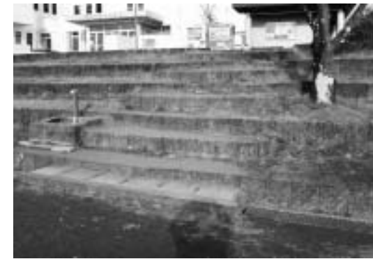
整備が待たれる階段

教育長 現在階段が2か所あるが、段差があるため高齢者等は不便であるので、安全性を考慮しながら