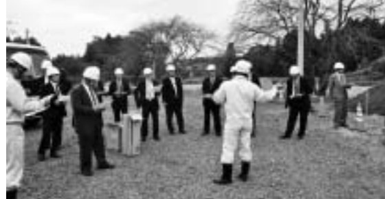
仮置き場の整備状況視察