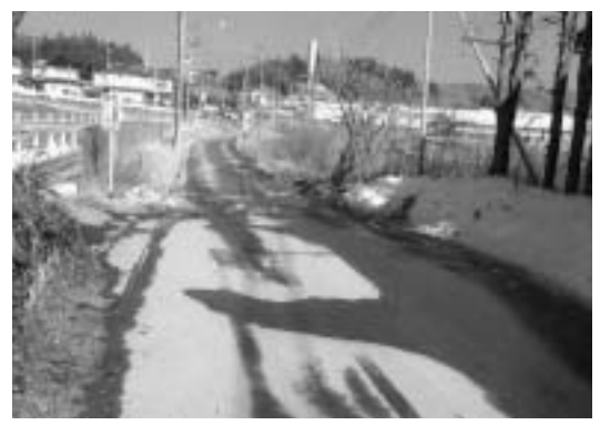
早期改修が待たれる町道

問 境界が決まっていない中で、どんな交渉をしているのか。 課長 地権者からの要望は、当該道路に接している全部の土地を購入してほしいとの要望である。