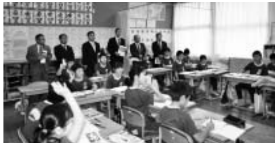
高野小でのICT授業参観