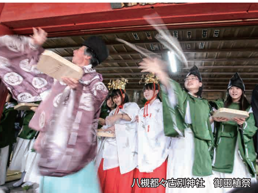
八槻都々古別神社 御田植祭