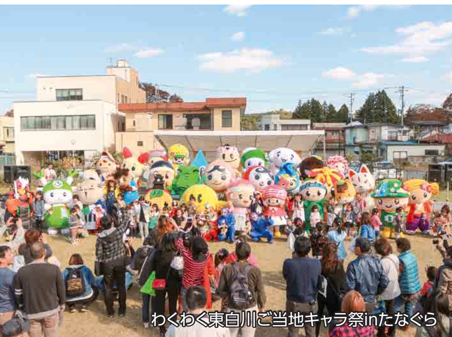
わくわく東白川ご当地キャラ祭inたなぐら