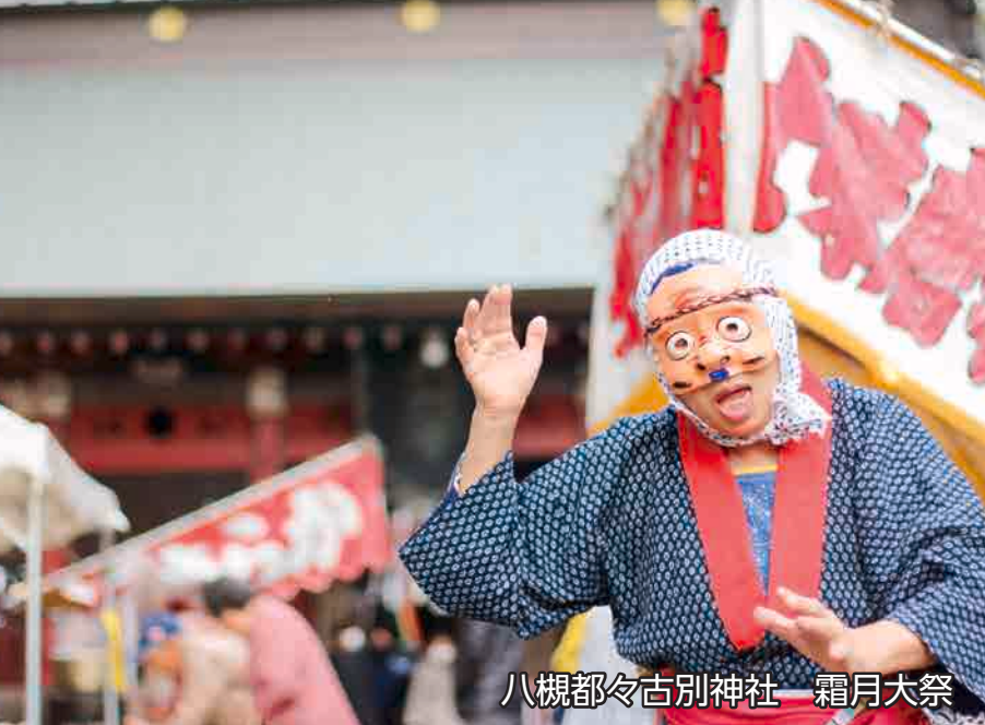
八槻都々古別神社 霜月大祭

国民健康保険税…6期 町県民税…4期 後期高齢者医療保険料…5期 国民年金…11月分 ※国民年金11月分の納期は1月4日までとなります。ご注意ください。