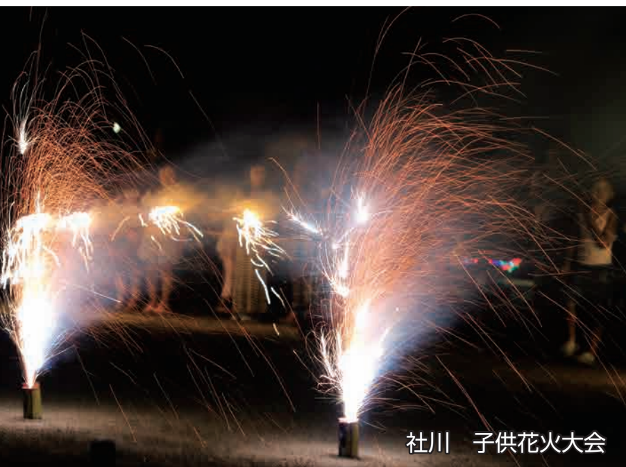
社川 子供花火大会