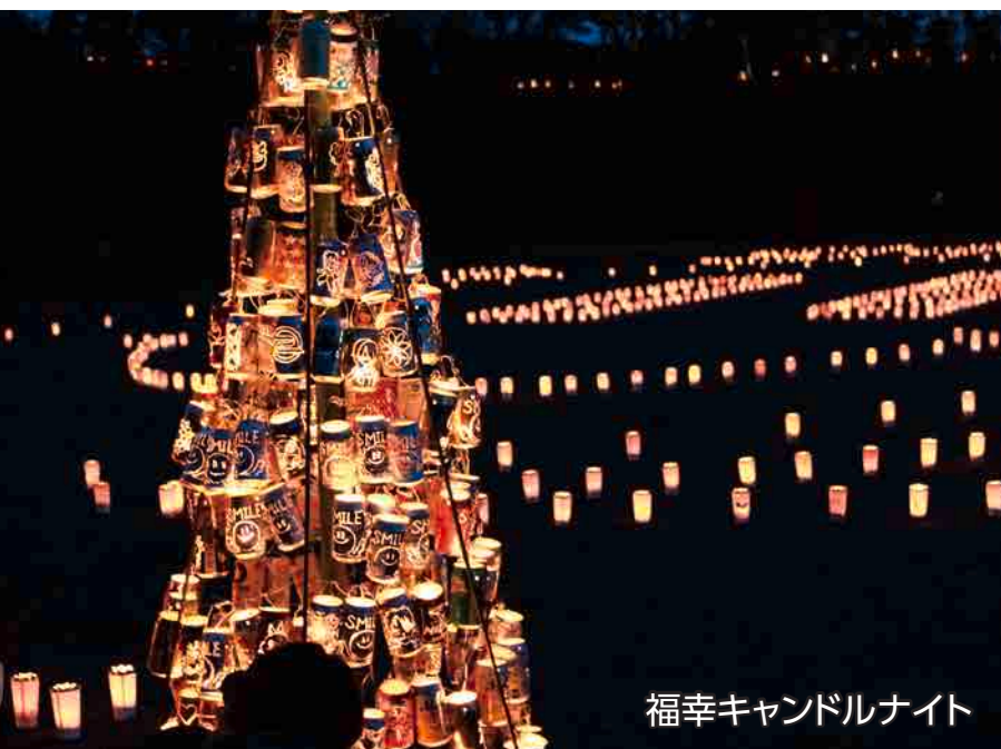
福幸キャンドルナイト