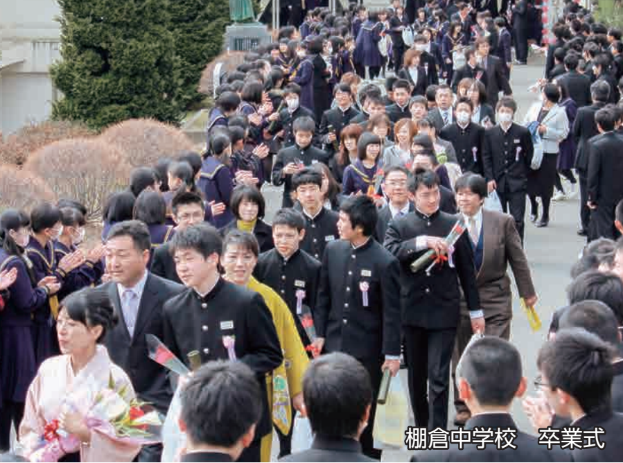
棚倉中学校 卒業式