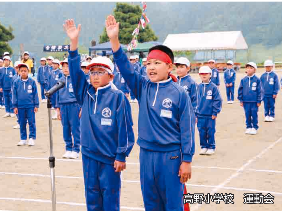
高野小学校 運動会