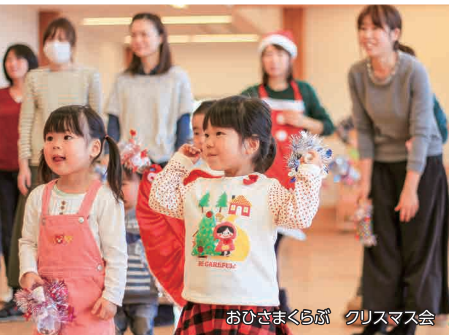
おひさまくらぶ クリスマス会