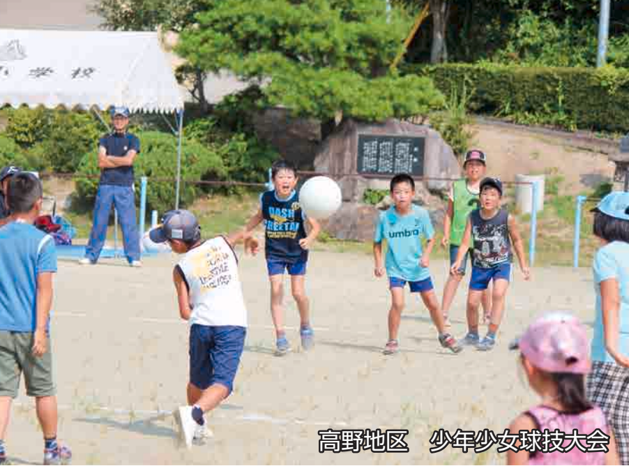
高野地区 少年少女球技大会