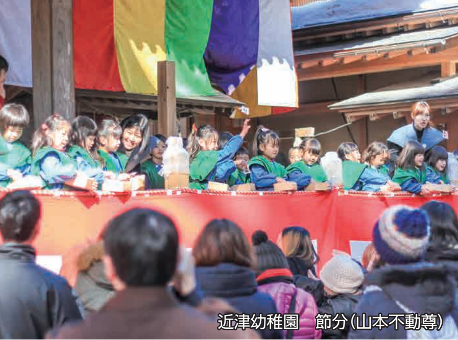
近津幼稚園 節分(山本不動尊)