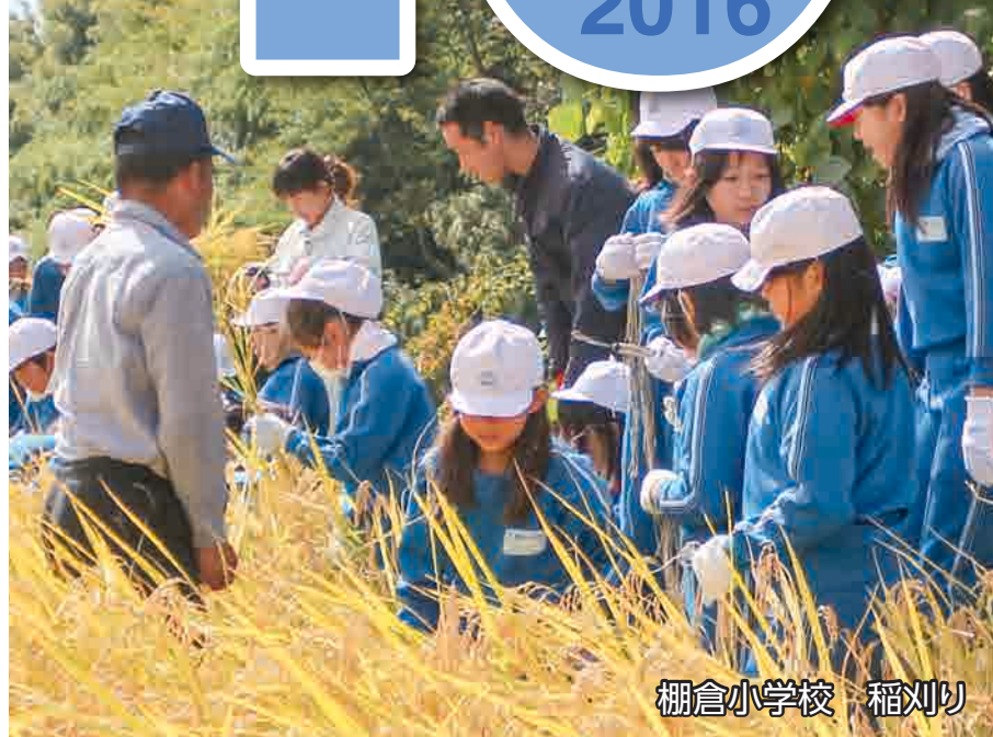
棚倉小学校 稲刈り