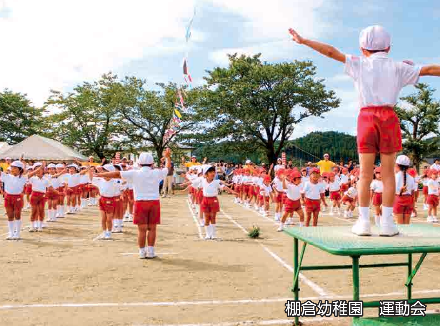
棚倉幼稚園 運動会