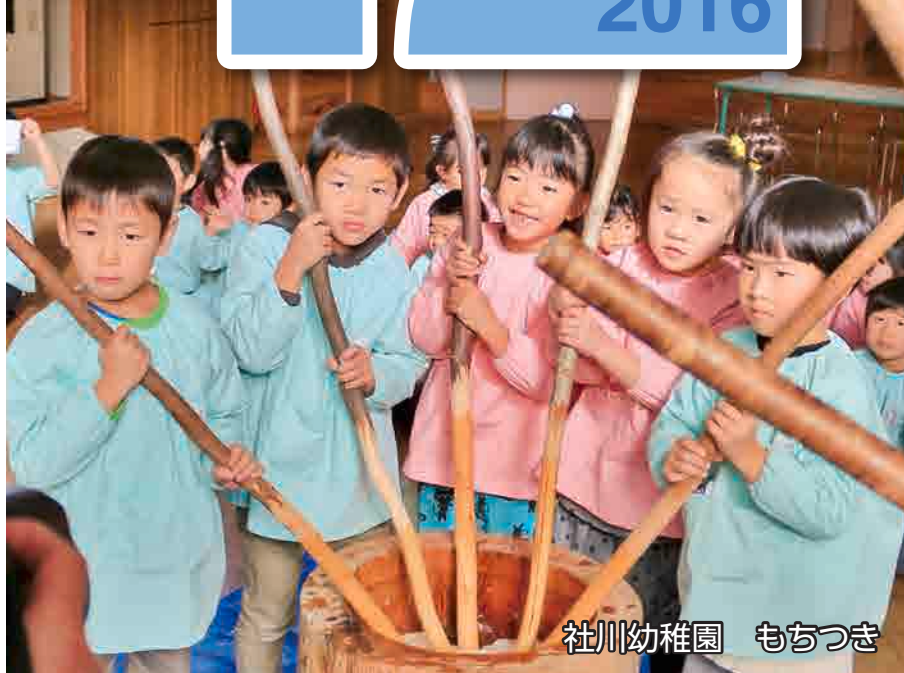
社川幼稚園 もちつき