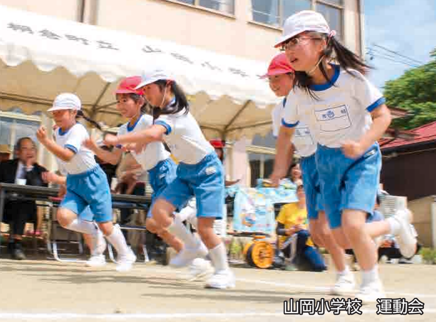
山岡小学校 運動会