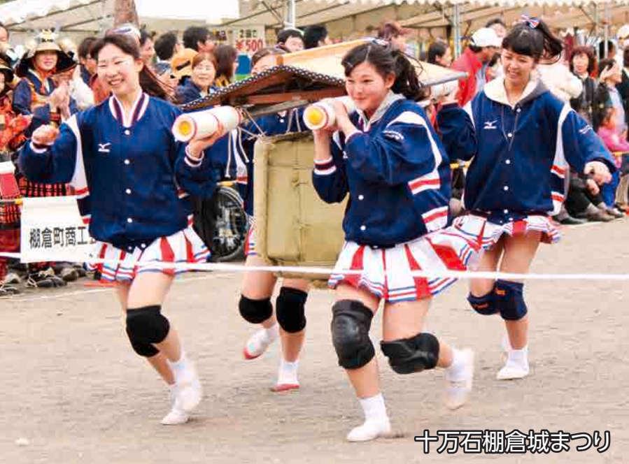
十万石棚倉城まつり