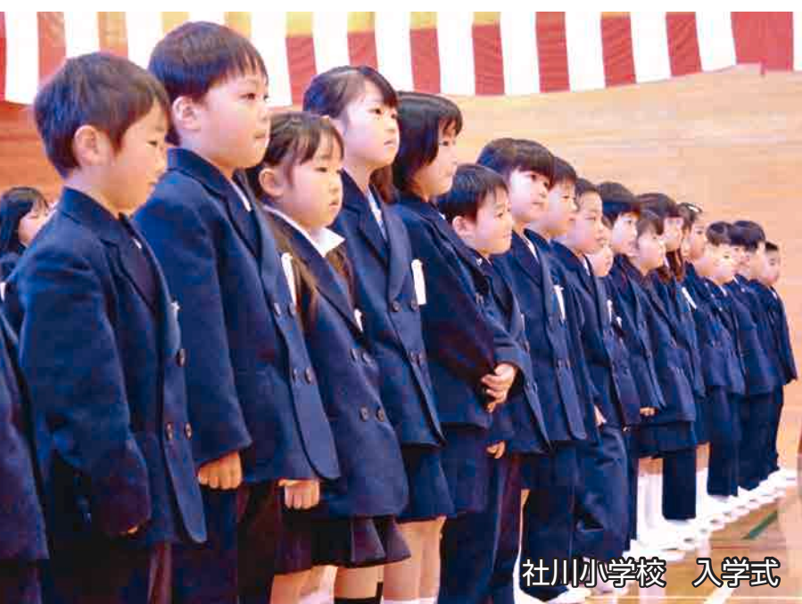
社川小学校 入学式