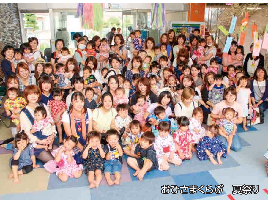
おひさまくらぶ 夏祭り