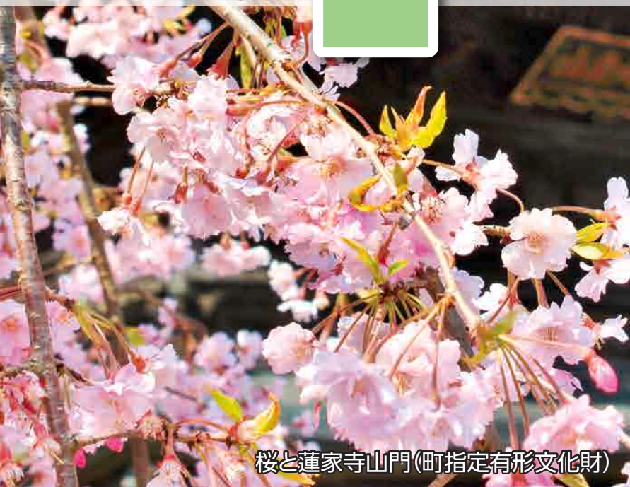
桜と蓮家寺山門(町指定有形文化財)