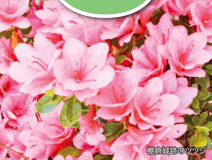
棚倉城跡のツツジ