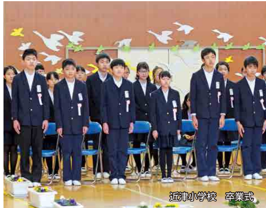
近津小学校 卒業式

日 SUN 月 MON 火 TUE 水 WED 木 THU 金 FRI 土 SAT