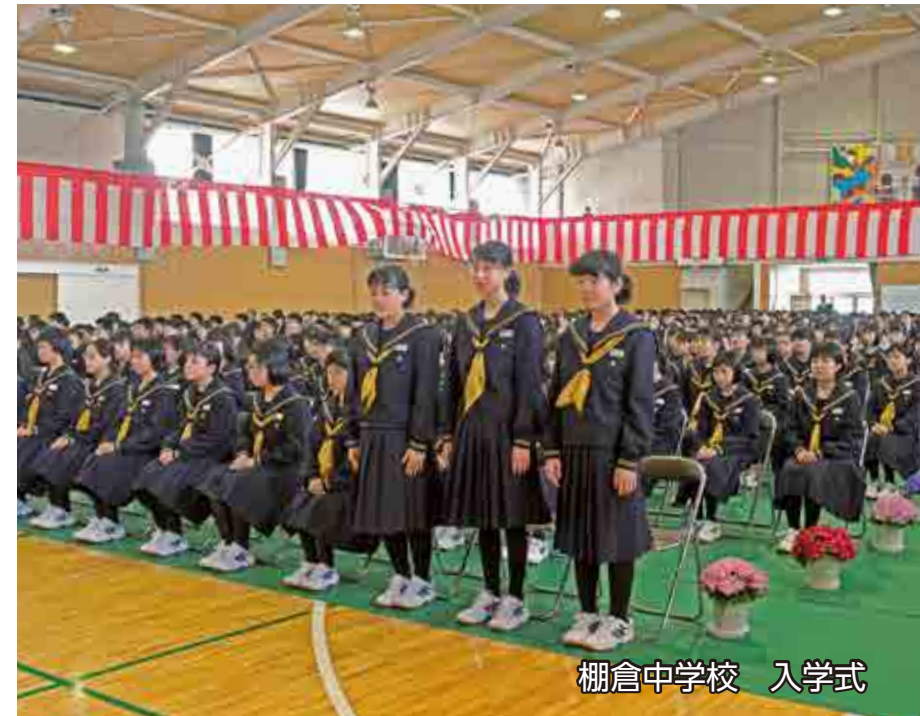
棚倉中学校 入学式

日 SUN 月 MON 火 TUE 水 WED 木 THU 金 FRI 土 SAT