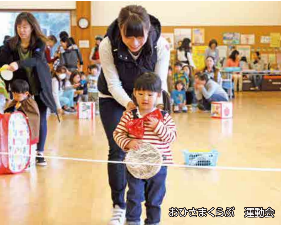
おひさまくらぶ 運動会