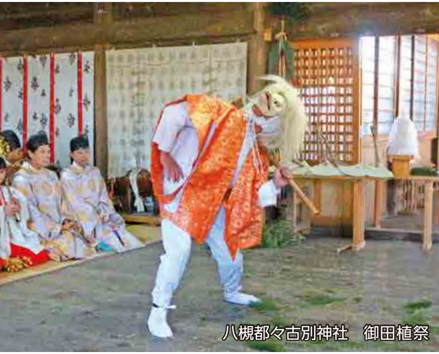
八槻都々古別神社 御田植祭