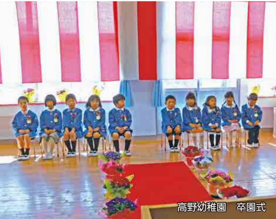
高野幼稚園 卒園式