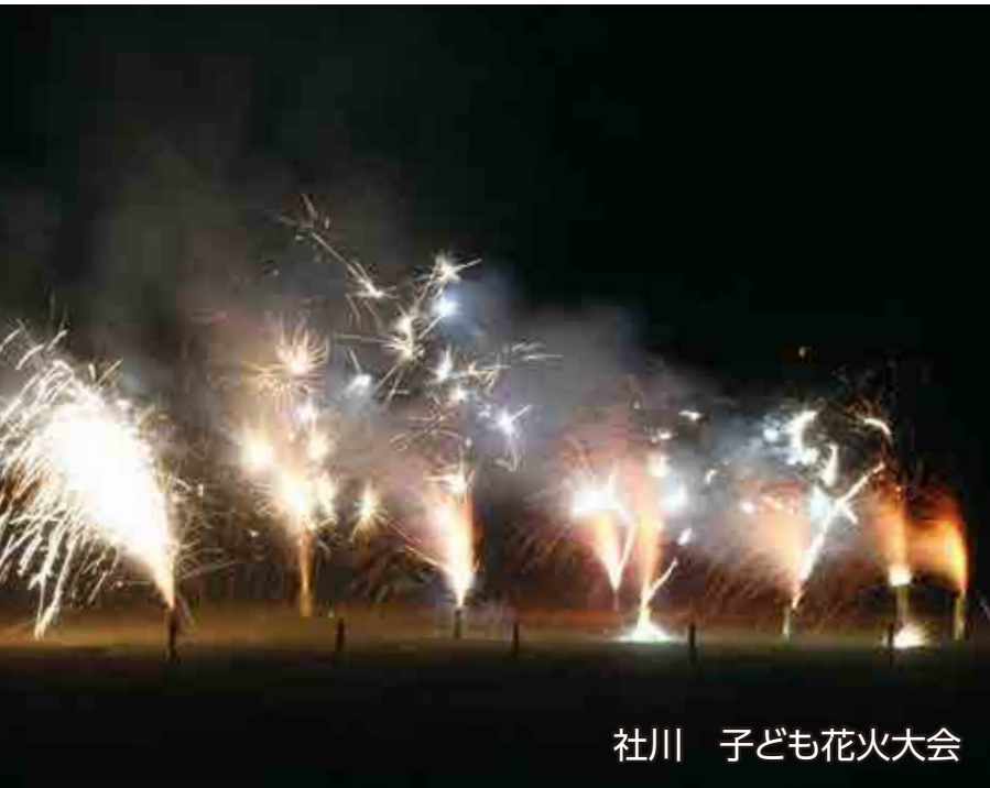
社川 子ども花火大会