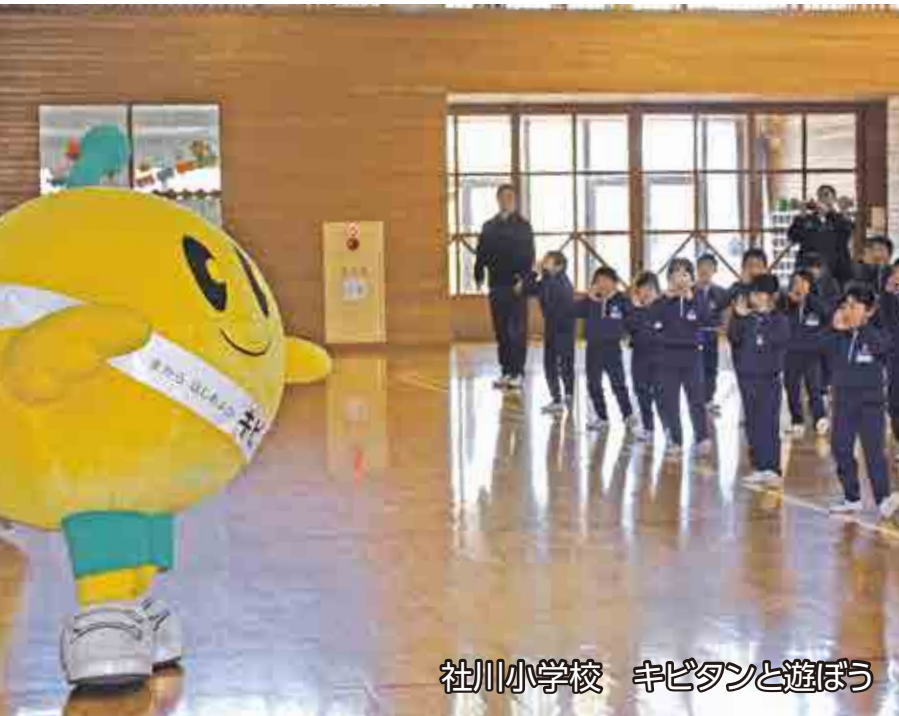
社川小学校 キビタンと遊ぼう