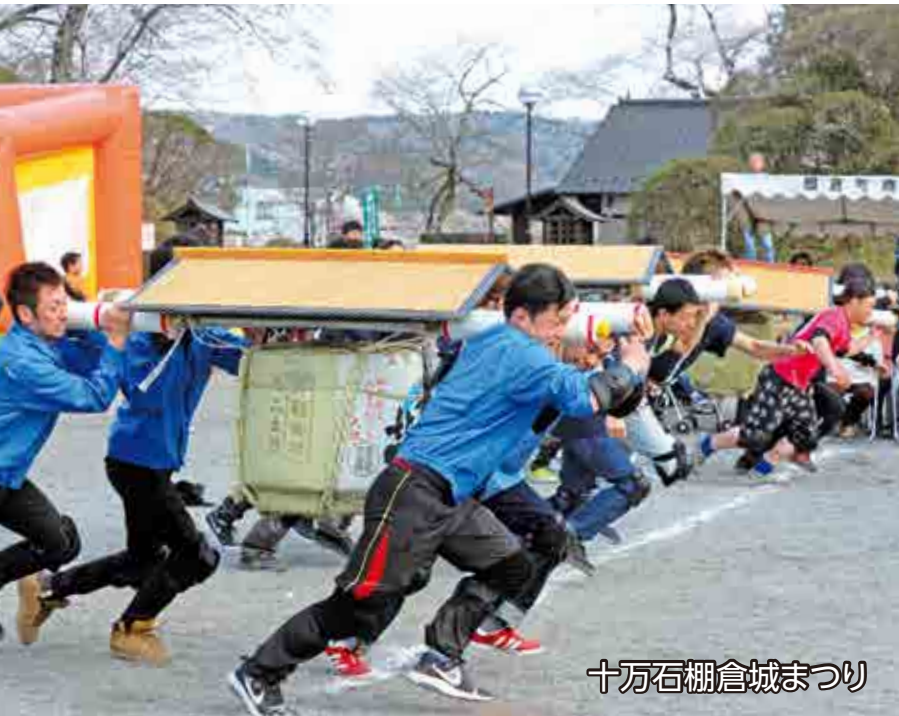
十万石棚倉城まつり