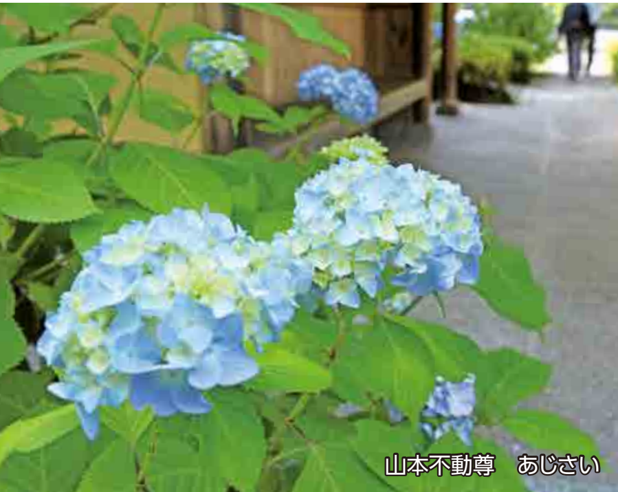
山本不動尊 あじさい