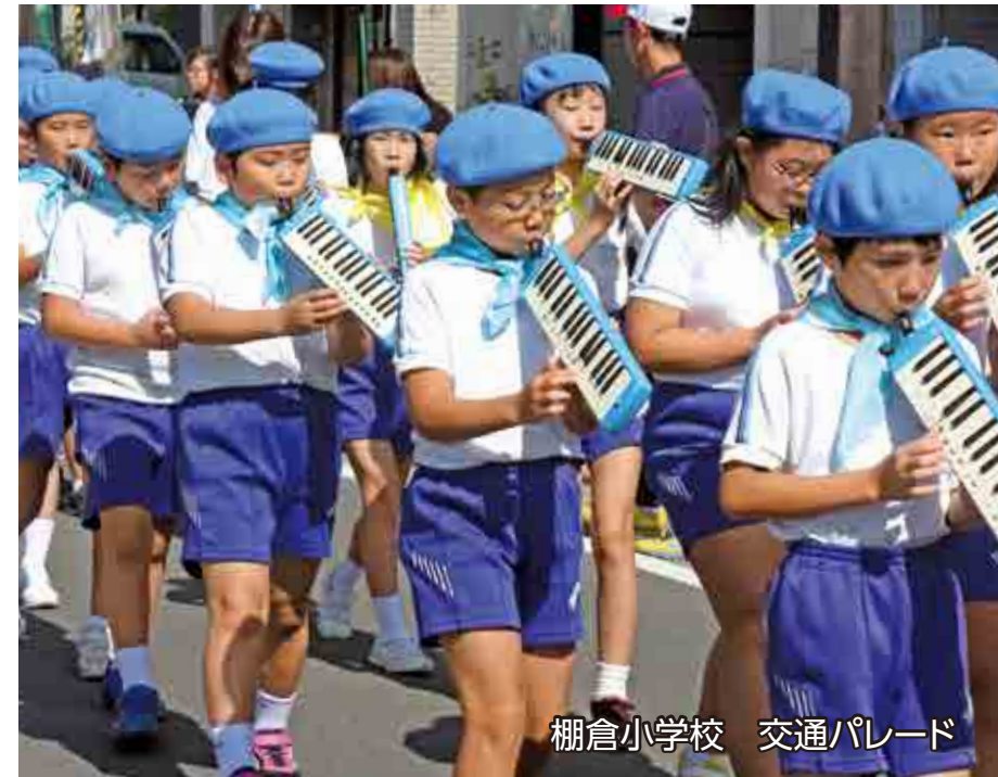
棚倉小学校 交通パレード

日 SUN 月 MON 火 TUE 水 WED 木 THU 金 FRI 土 SAT