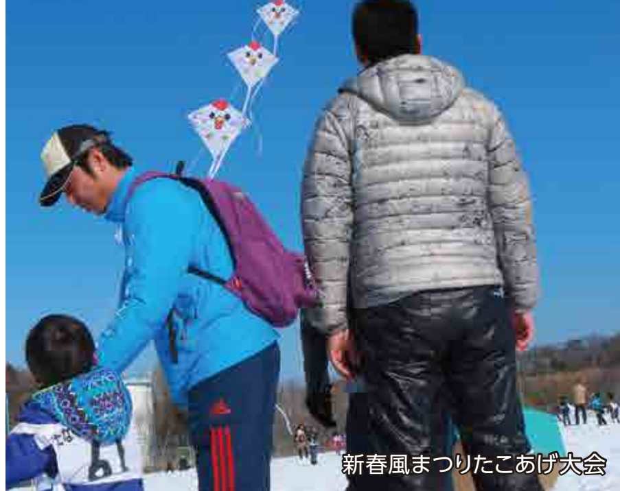
新春風まつりたこあげ大会