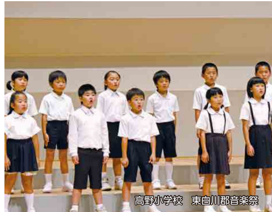
高野小学校 東白川郡音楽祭