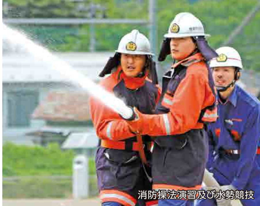
消防操法演習及び水勢競技