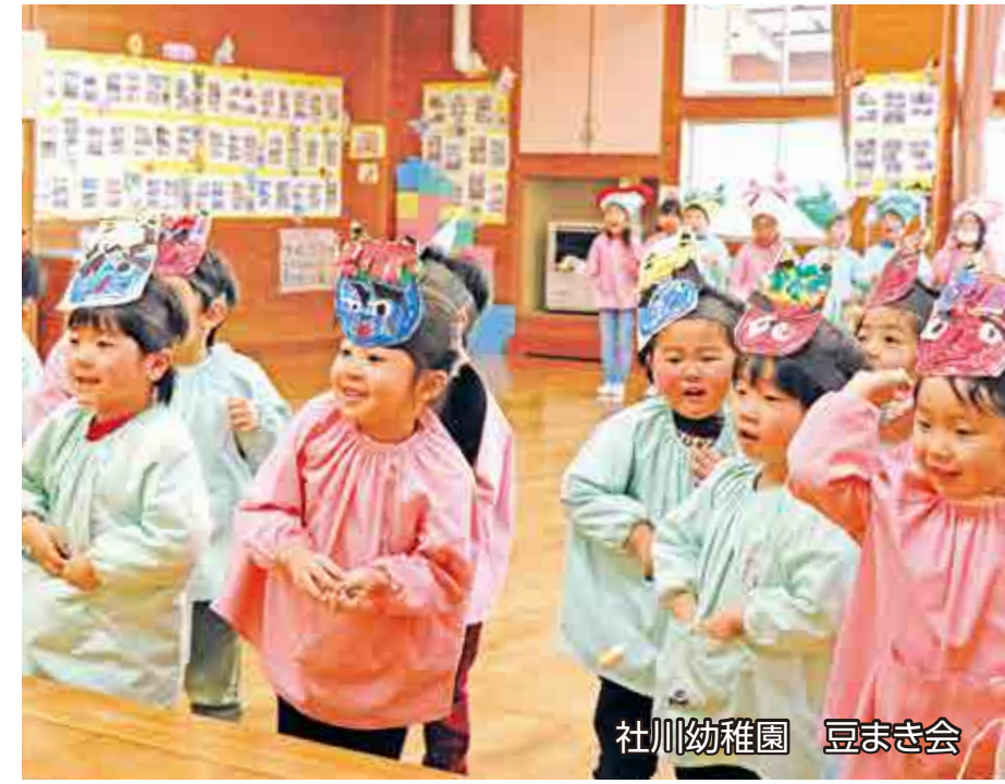
社川幼稚園 豆まき会