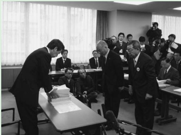
▶棚倉町長・西郷村長から平野大臣に要望書提出