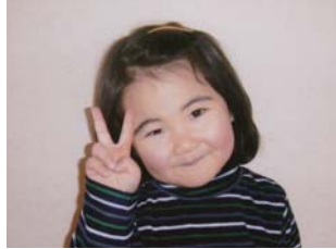
むとう えんぞくん 【家族からの一言コメント！】 歯みがき、フロスちゃんとやっています！