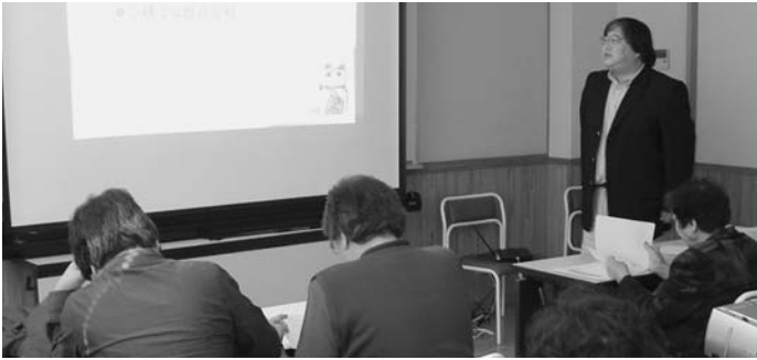
▲認知症サポーター養成講座を受けるみなさん