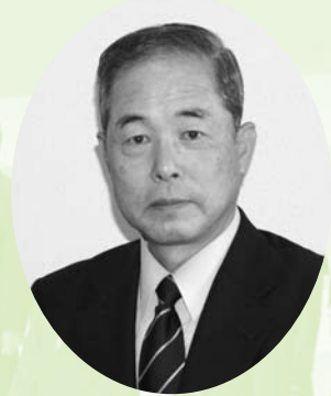
棚倉町教育委員会 教育長 渡邊勇喜