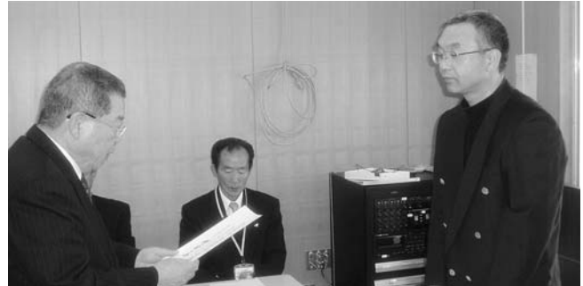
▲新任の民生委員・児童委員のみなさんへ委嘱状が交付されました