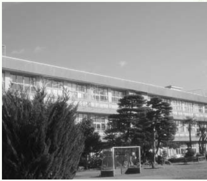
▲耐震補強改修工事が予定されている近津小学校の校舎

さらに、昨年度より柵倉保育園から柵倉幼稚園に入園した園児を対象に実施している「子育て支援対策保育」を拡大し、