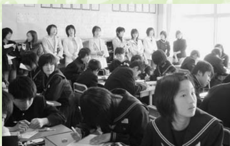
▲棚倉中学校も二学期制が始まります

まず、平成十九年度から町内各幼稚園・小学校に導入させていただきました「二学期制」につきましては、多くの方々から深