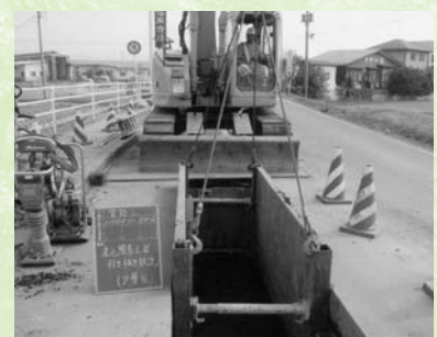
▲今後も公共下水道整備が推進されます

年頭に当たりまして、皆様の御健勝と御多幸をお祈り申し上げ新年の御挨拶といたします。