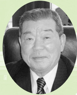
棚倉町長 藤田幸治