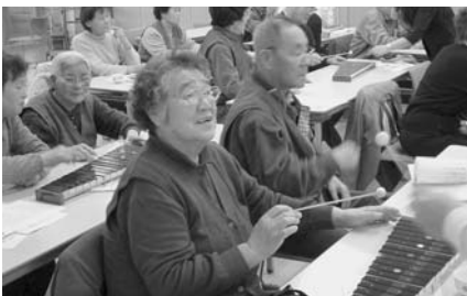
▲頭はつらつ教室～まずやってみようとする気持ちが大事 (音楽療法～木琴でα波♪♪)