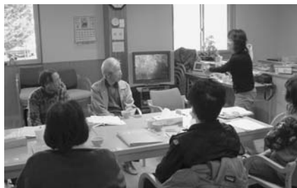
▲口腔ケア教室～口腔頭微鏡で自分の歯周菌や虫歯菌を見ました。おどろき!!