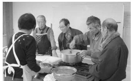
▲栄養教室～「ここへ来ると勉強になる」と参加者の方 (^.^)