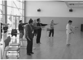
▲シニア筋力アップ教室～太極拳に挑戦してみました。転倒予防に効果的！

介護予防で「元氣高齢者」を目指す！ 介護保険認定を受ける方は、年々増加の一途をたどっています。いつまでも自分らしく、楽しみのある生活を送るためには、介護が必要にならないように、また介護が必要な方はそれ以上に状態が悪化しないように介護予防