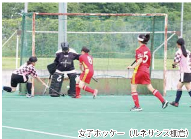
女子ホッケー (ルネサンス棚倉)