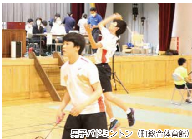
男子バドミントン (町総合体育館)