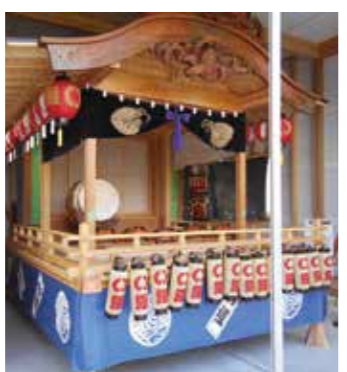
第四区自治会が整備した屋台