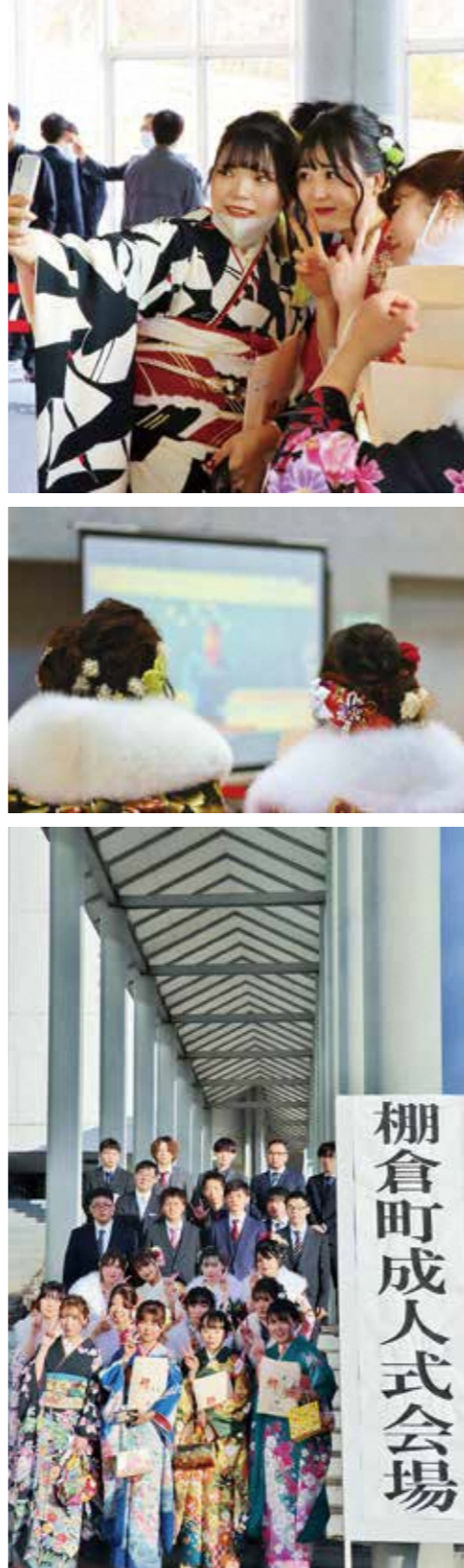
棚倉町成人式会場

成人式の様子をYouTubeで配信しています 令和4年成人式の様子はYouTubeで見ることができ、ぜひご覧ください。