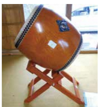
第三区行政区自治会が整備した太鼓

(一財)自治総合センターが実施している令和3年度コミュニティ助成事業(宝くじ助成)を受け、第三区行政区自治会が太鼓や笛、半纏などの祭り用品、第四区自治会が祭り用屋台を整備しました。