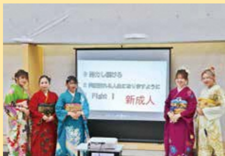
成人式実行委員の皆さん

今回、成人式実行委員の皆さんは、恩師の方々からのビデオメッセージを集め動画を作成しました。動画を見た新成人の皆さんは、久しぶりにみる恩師の姿に思わず笑顔になり、思い出話に花を咲かせていました。