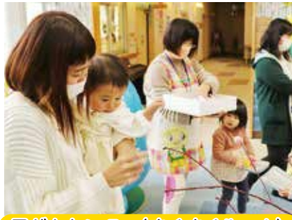
子どもセンター(すくすくルーム)