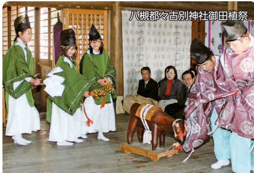
八槻都々古別神社御田植祭

※変更になる場合がありますので、広報たなぐらの「保健福祉センターだより」でご確認ください。