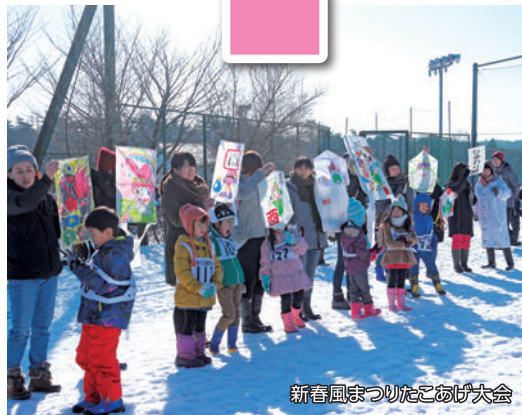
新春風まつりたこあげ大会