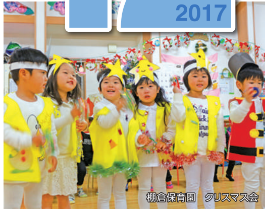
棚倉保育園 クリスマス会