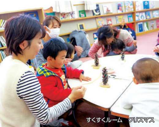
すくすくルーム クリスマス