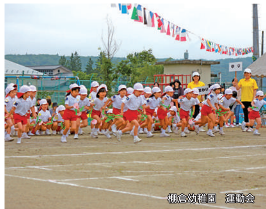
棚倉幼稚園 運動会