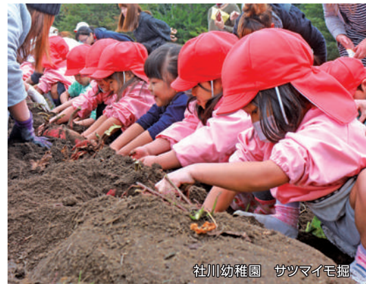
社川幼稚園 サツマイモ掘