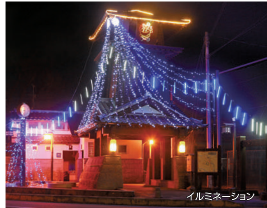
イルミネーション