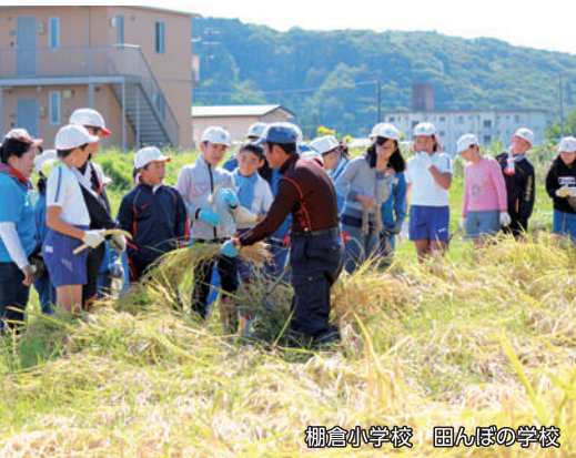
棚倉小学校 囲んぼの学校