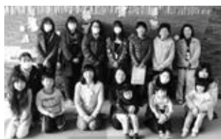
去年の交流会の様子

日時 3月25日(土)10時～12時 内容 簡単なおもちゃ作りと3B体操 場所 子どもセンター その他 参加費は無料です。 運動できる服装でお越しください。