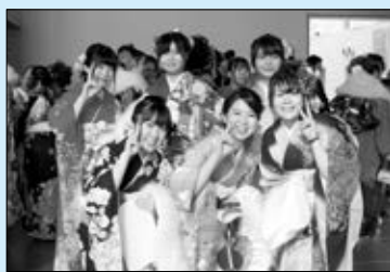
平成29年棚倉町成人式