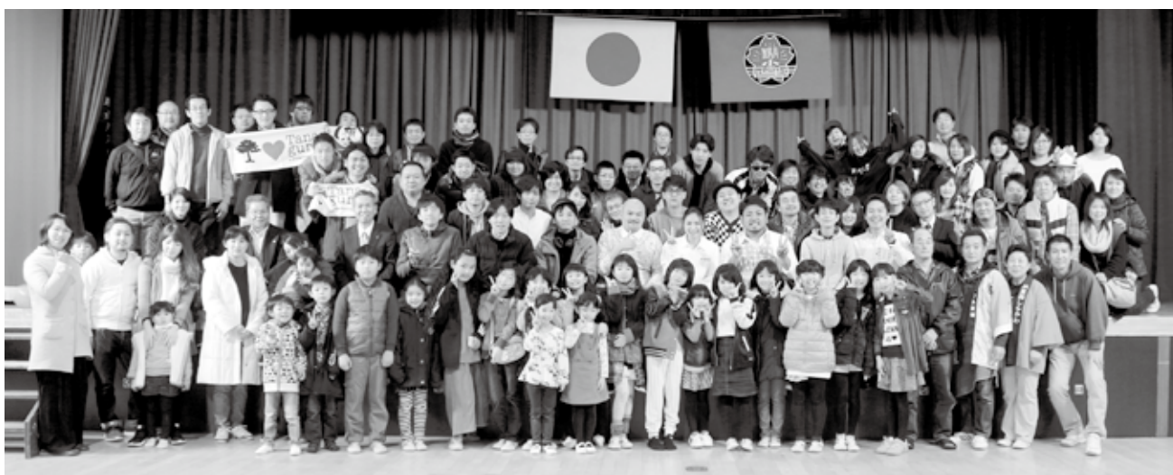
▲ 多くの町民の協力をいただきクランクアップ(23日)