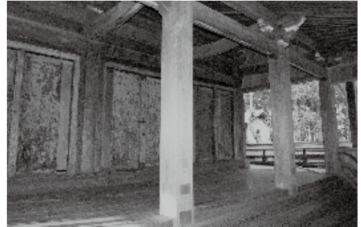
福島県地域創生総合支援事業