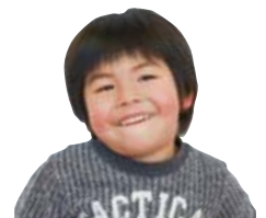
すずき けんとかん 毎日歯みがきががんばってます