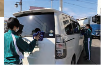
▲農業生産法人(株)八幡の様子