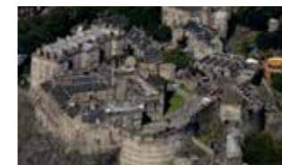
▲エディンバラ城の外観と内部