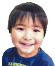
ほし ゆいとくん 毎日、歯磨きがな ばっています。