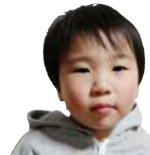
しもじゅう ゆうせいくん 毎日歯みがきがな ばっています。