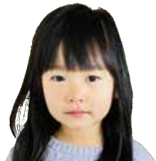
たきふか まやちゃん まいにちみがいてピ カピカにしています♡