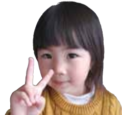
いしい みあちゃん 毎日歯みがきがな ばっています。