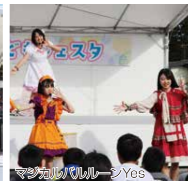
マジカルバルーンYes