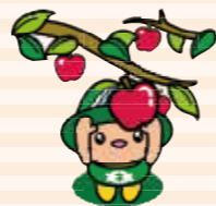
袋田の滝キャラクター たき丸

平成26年1月、栃木県(大田原市・那須塩原市・那須町・那珂川町)・福島県(棚倉町・矢祭町・塙町)・茨城県(大子町)の2市6町による「八溝山周辺地域定住自立圏」が形成されました。圏域の地域活性化につなげる取り組みの一環として、圏域市町のPR情報をお届けします。今月は大子町です。