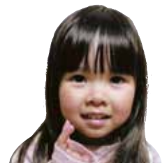
いしばし せなちゃん おねえちゃんと歯みが きががんばってます。