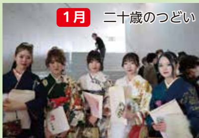
1月 二十歳のつどい