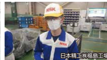
日本精工(株)福島工場