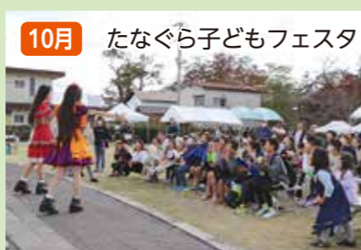
10月 たなぐら子どもフェスタ