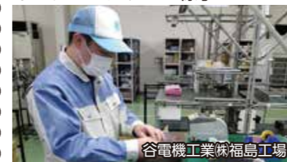
谷電機工業(株)福島工場