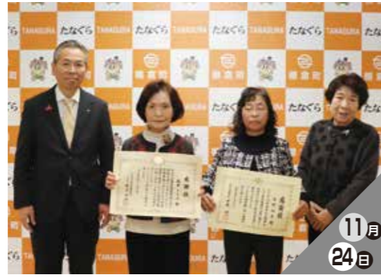
更正保護活動に貢献

長年の献血活動が高く評価され、トヨタカローラ福島棚倉店に公衆衛生事業功労知事感謝状が授与されました。同店の献血活動は20年以上を数え、周辺住民および社員に計画的に呼びかけを行い、毎回安定した献血者を確保したことにより、今回の感謝状授与となりました。