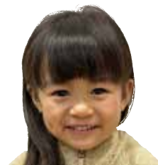
こんどう あさひちゃん おねえちゃんとはみが きががんばってます。