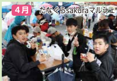
4月 たなぐらsakuraマルシェ