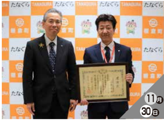
長年の献血活動を評価

長年の献血活動が高く評価され、トヨタカローラ福島棚倉店に公衆衛生事業功労知事感謝状が授与されました。同店の献血活動は20年以上を数え、周辺住民および社員に計画的に呼びかけを行い、毎回安定した献血者を確保したことにより、今回の感謝状授与となりました。