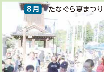
8月 たなぐら夏まつり