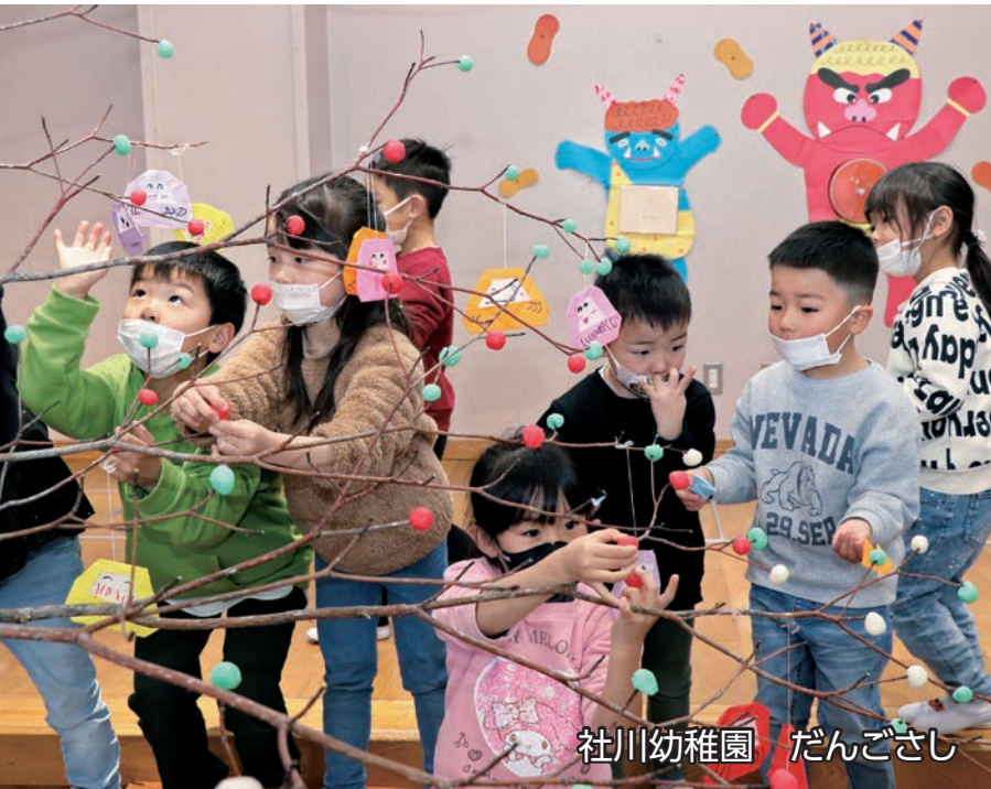
社川幼稚園 だんごさし