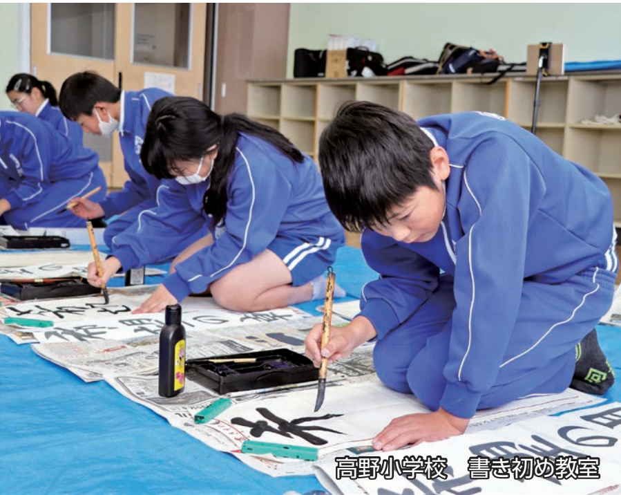
高野小学校 書き初め教室