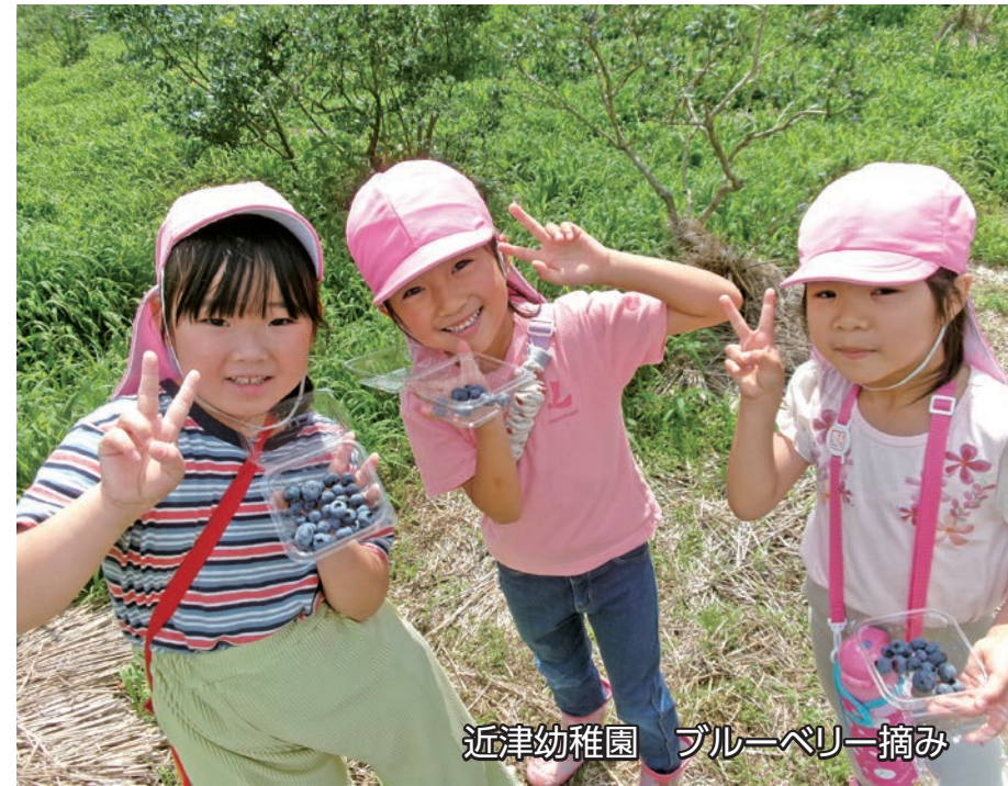
近津幼稚園 ブルーベリー摘み