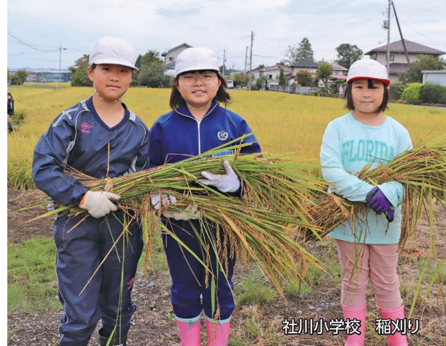
社川小学校 稲刈り