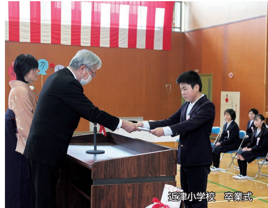
近津小学校 卒業式

日 SUN 月 MON 火 TUE 水 WED 木 THU 金 FRI 土 SAT