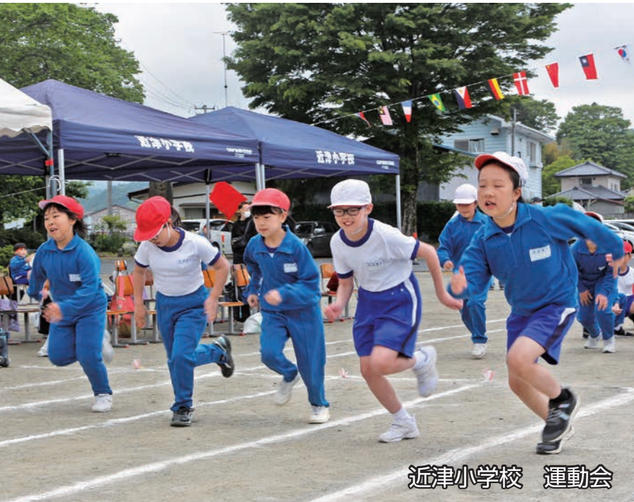
近津小学校 運動会