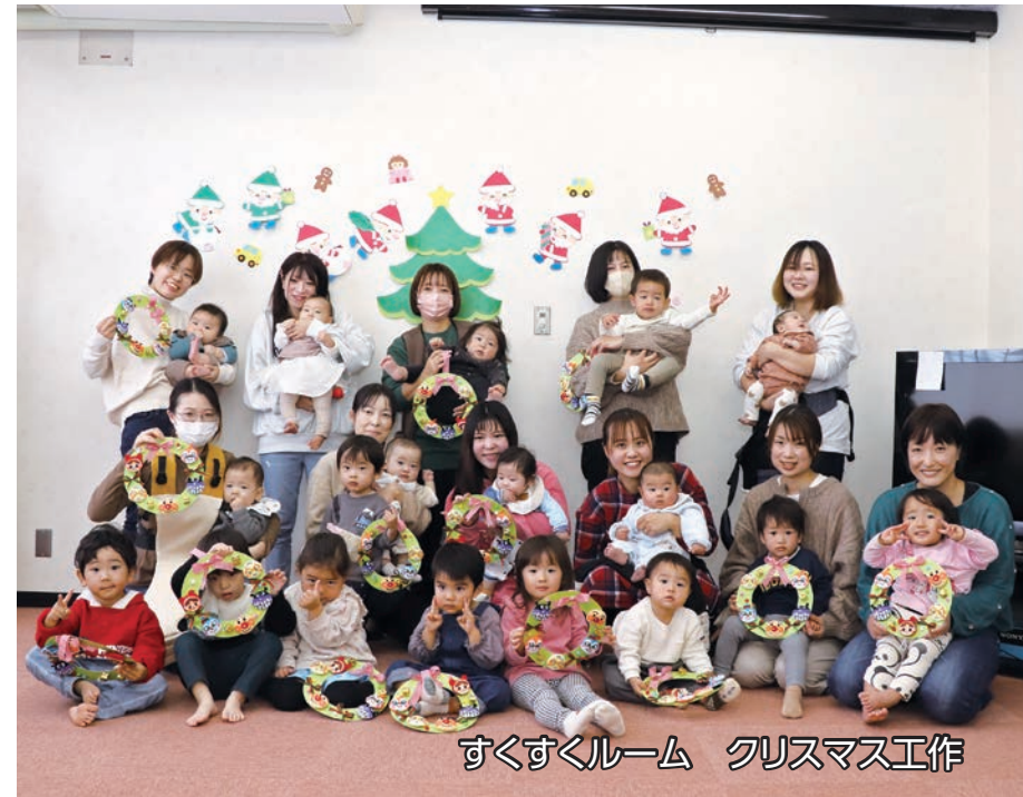
すくすくルーム クリスマス工作