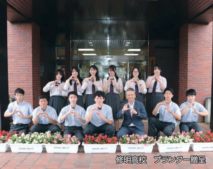
修明高校 プランター贈呈