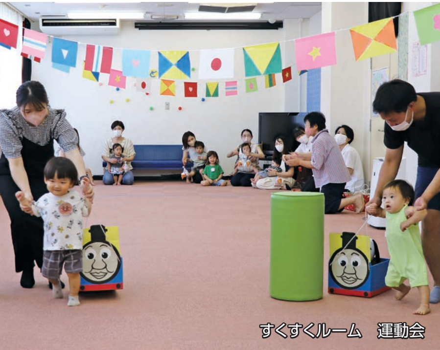
すくすくルーム 運動会