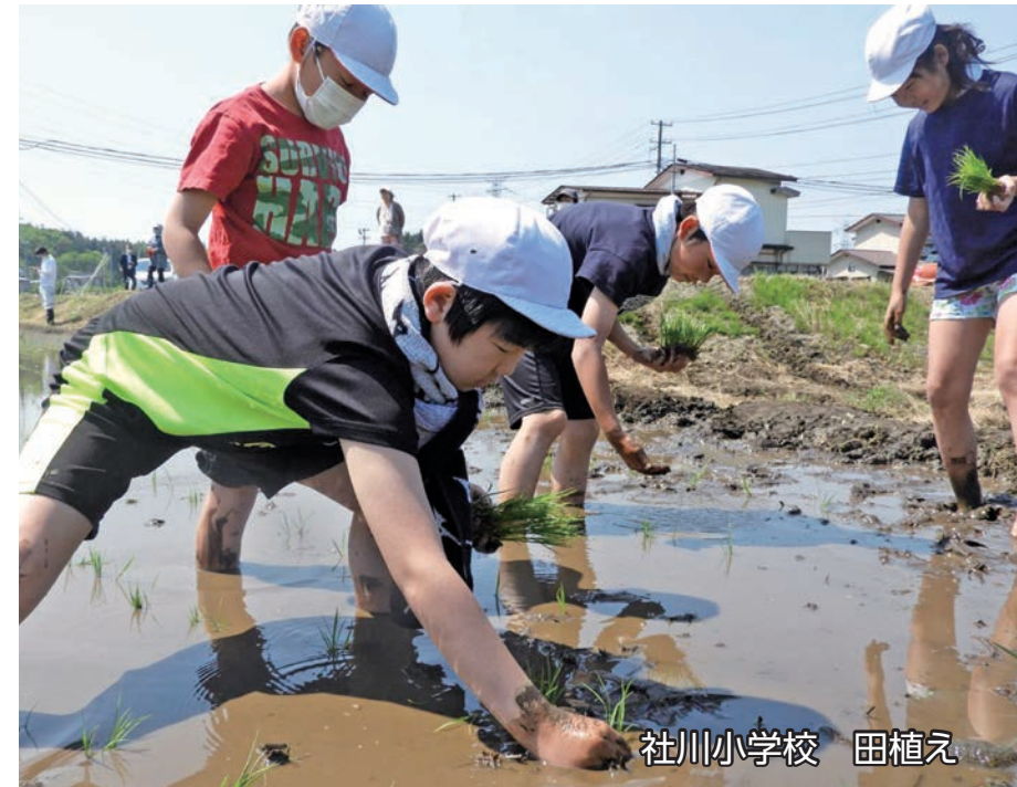
社川小学校 田植え

日 SUN 月 MON 火 TUE 水 WED 木 THU 金 FRI 土 SAT