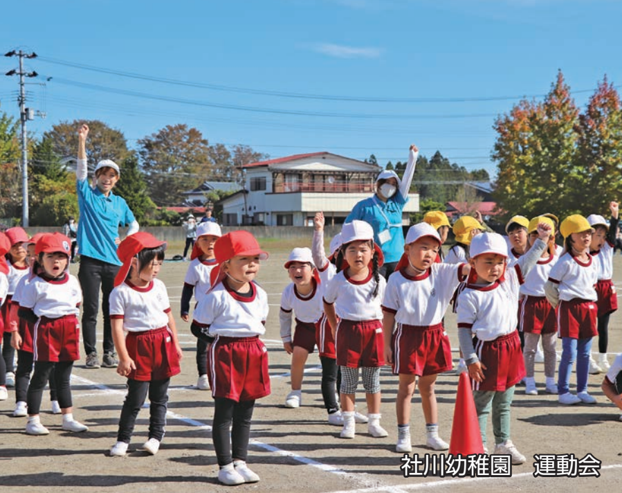
社川幼稚園 運動会