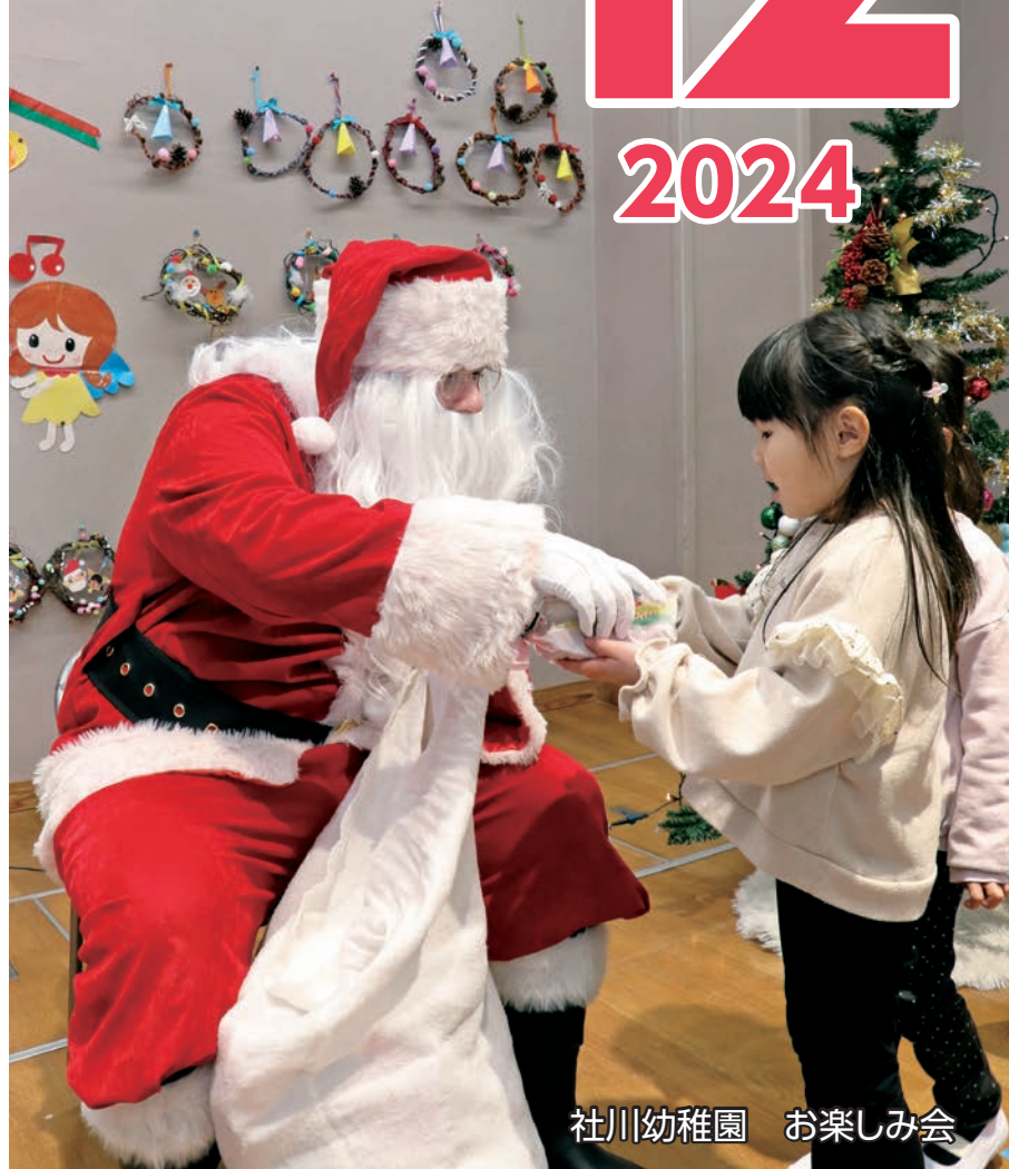
社川幼稚園 お楽しみ会