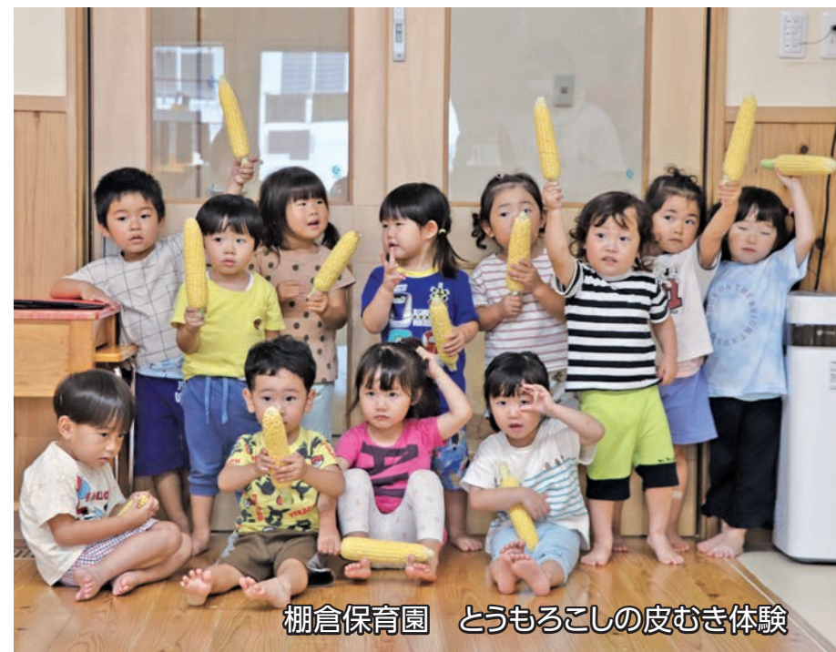
棚倉保育園 とうもろこしの皮むき体験