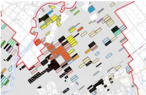
目標地図のイメージ