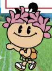
棚倉町シンボルキャラクター たなちゃん