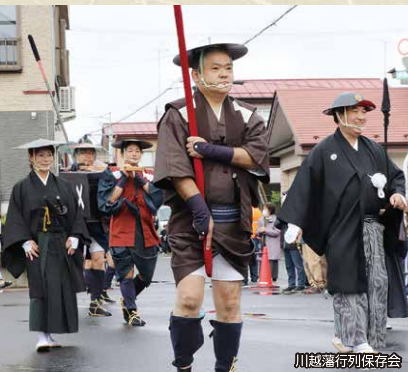
川越藩行列保存会