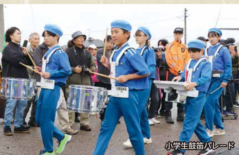
小学生鼓笛パレード