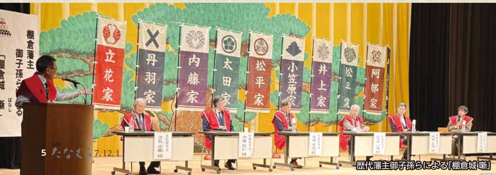
歴代藩主御子孫らによる「棚倉城」