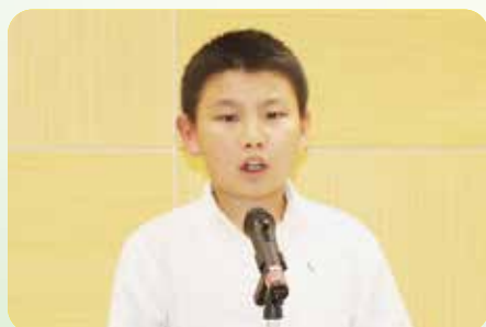
閉校に向けて今思うこと

大好きな地域の方々との触れ合いを通して、地域のために何ができるのかという、地域の中で自分の果たす役割に思いを馳せていることが素晴らしいです。これからも、自分は社会の中でどんな役割を果たすのかを考え続けていましょう。