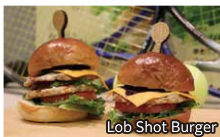
Lob Shot Burger