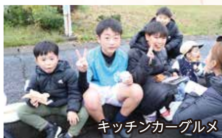
キッチンカーグルメ