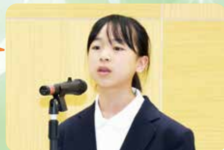
『伝統を受けついでいく』リレーの走者に～

学校や地域の伝統を受け継ぐという自らの体験から、仲間と創り上げていく楽しさや、次に伝える役割に気づいたことが素晴らしいです。これからも、多くの方々からバトンを受け取り、仲間とともに走り抜き、次に渡していましょう。