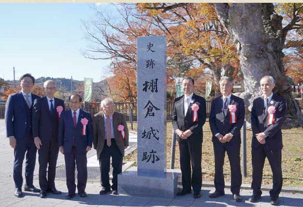
史跡標識の除幕式