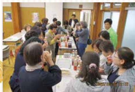
▲野菜ジュースの飲料を試飲している様子