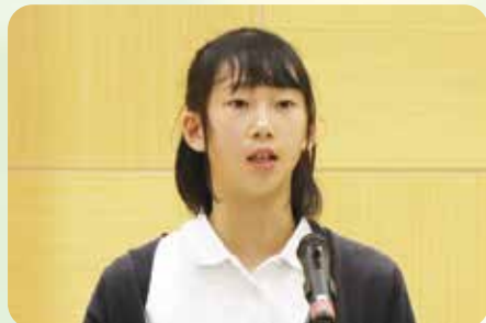
あたり前のありがたさ