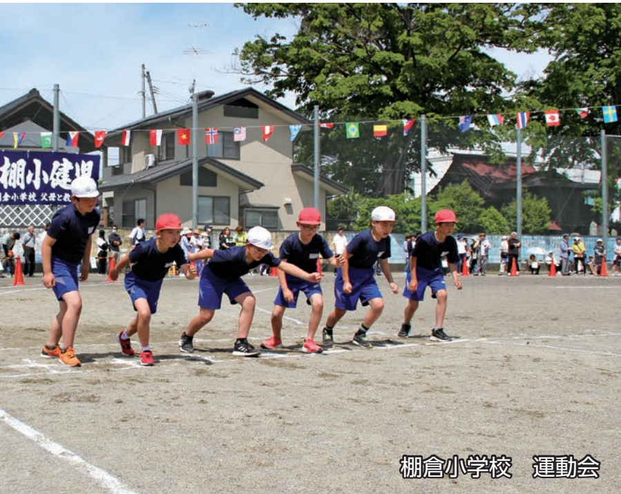
棚倉小学校 運動会