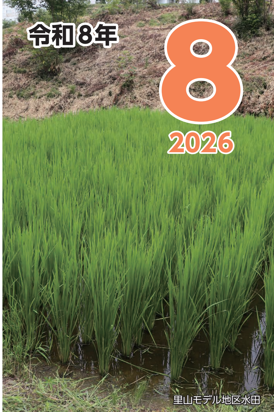
里山モデル地区水田