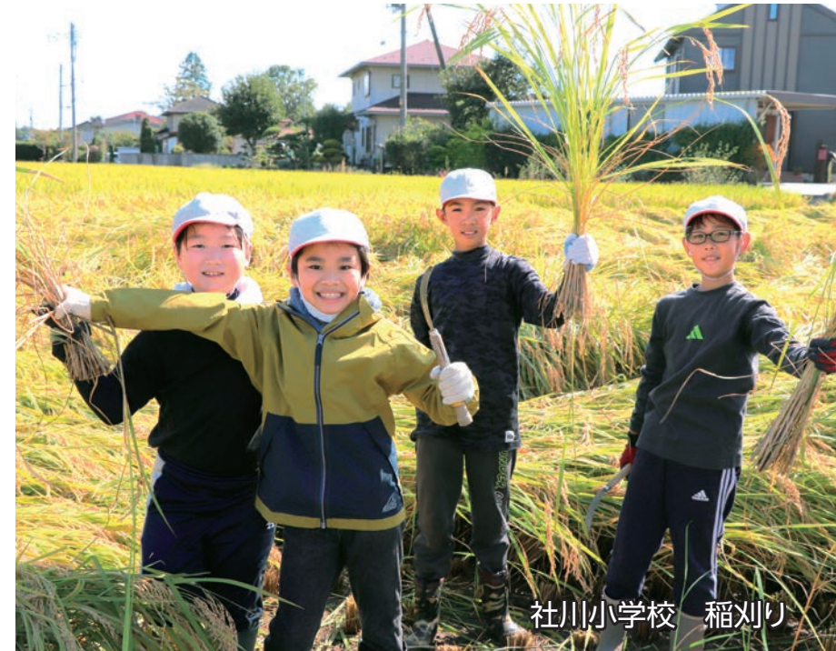
社川小学校 稲刈り

日 SUN 月 MON 火 TUE 水 WED 木 THU 金 FRI 土 SAT