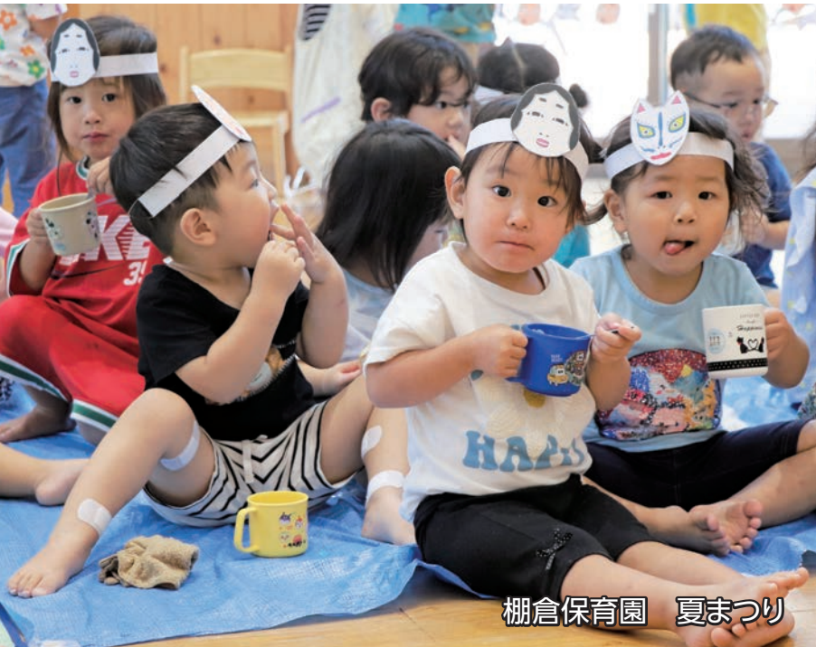
棚倉保育園 夏まつり