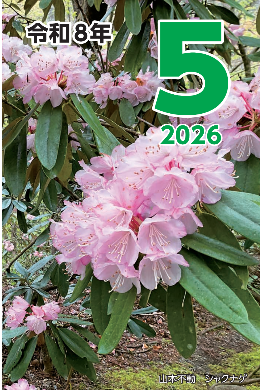
山本不動産 シャクナゲ