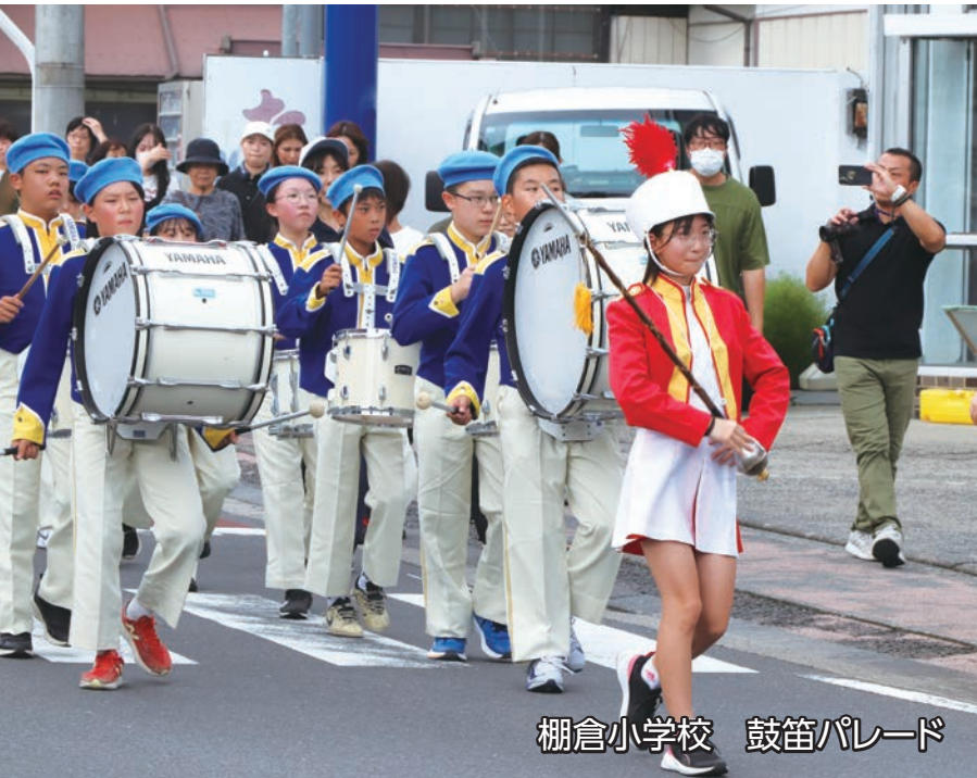
棚倉小学校 鼓笛パレード