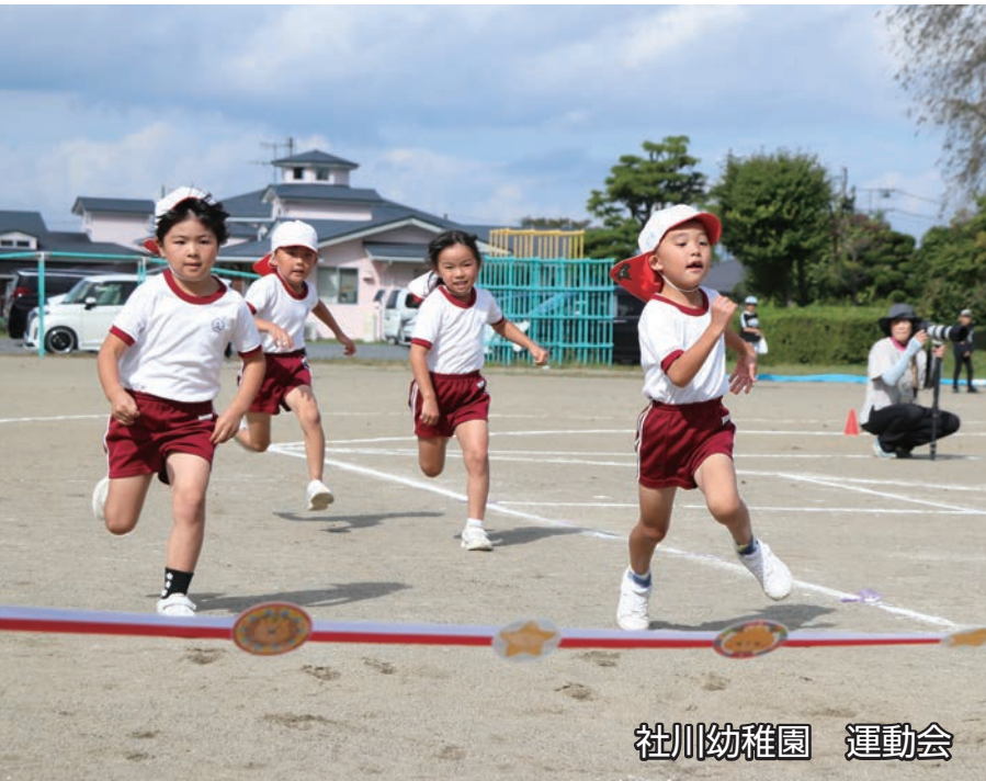
社川幼稚園 運動会