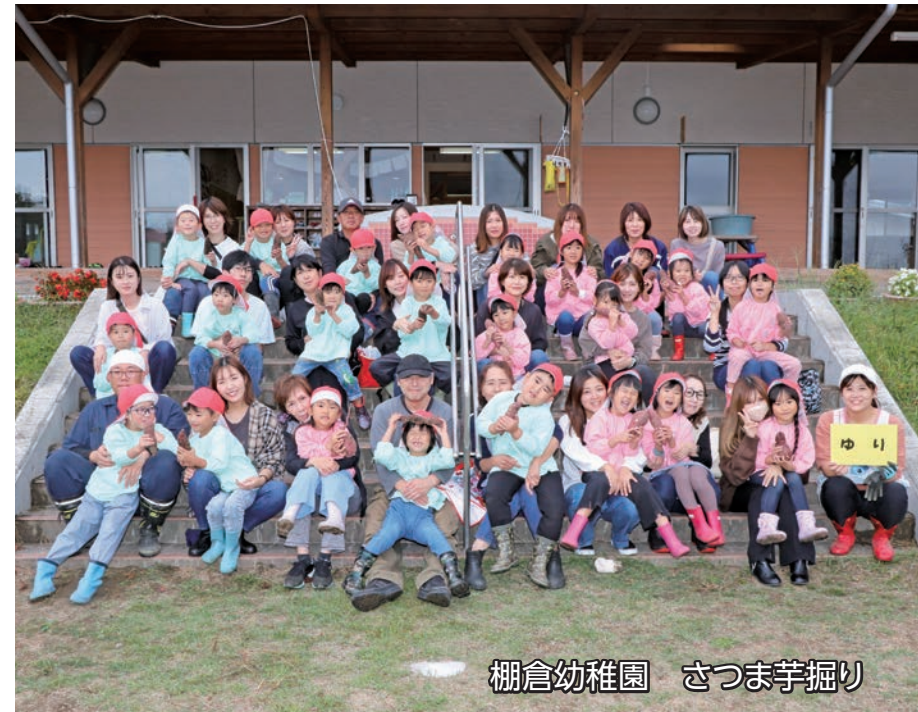
棚倉幼稚園 さつま芋掘り

日 SUN 月 MON 火 TUE 水 WED 木 THU 金 FRI 土 SAT