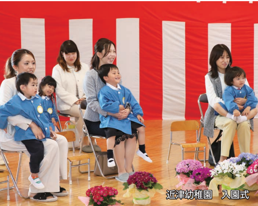
近津幼稚園 入園式