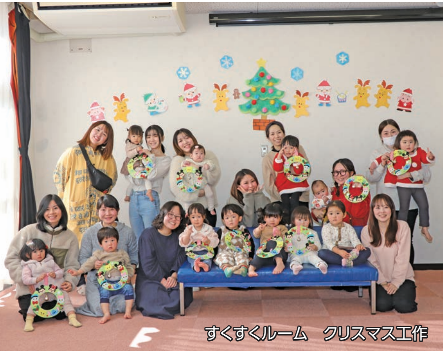
すくすくルーム クリスマス工作