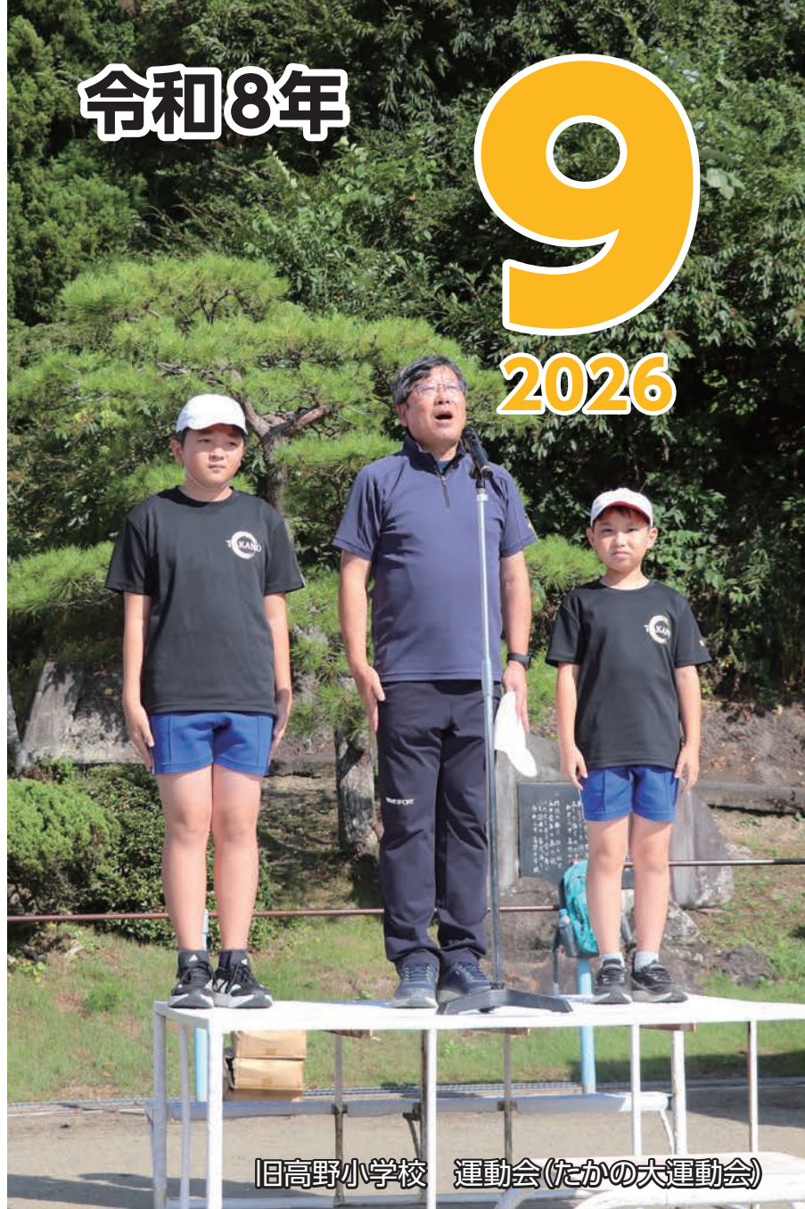
旧高野小学校 運動会(たかの大運動会)