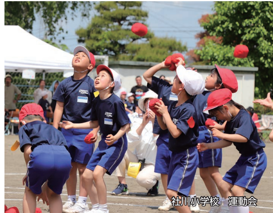
社川小学校 運動会

日 SUN 月 MON 火 TUE 水 WED 木 THU 金 FRI 土 SAT