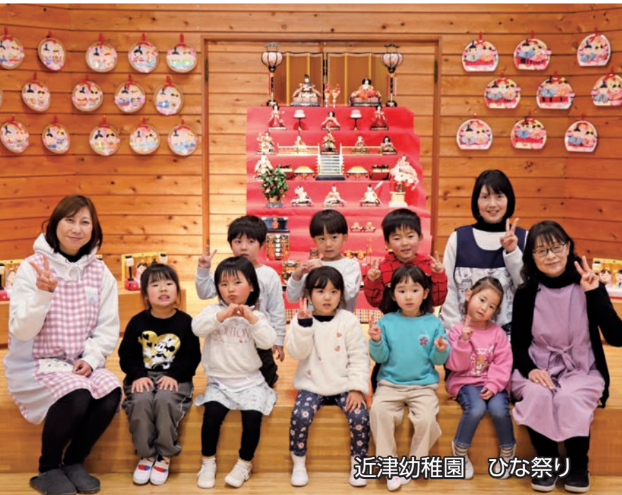
近津幼稚園 ひな祭り