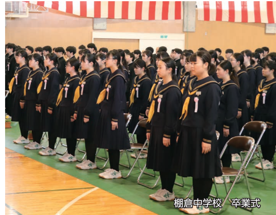
棚倉中学校 卒業式