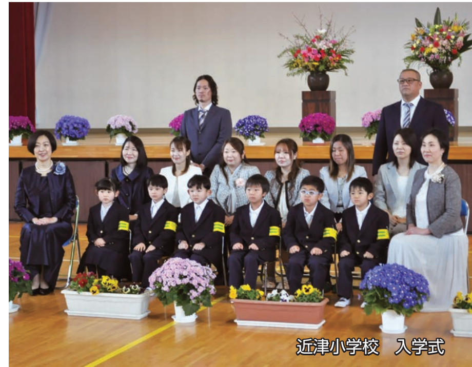
近津小学校 入学式