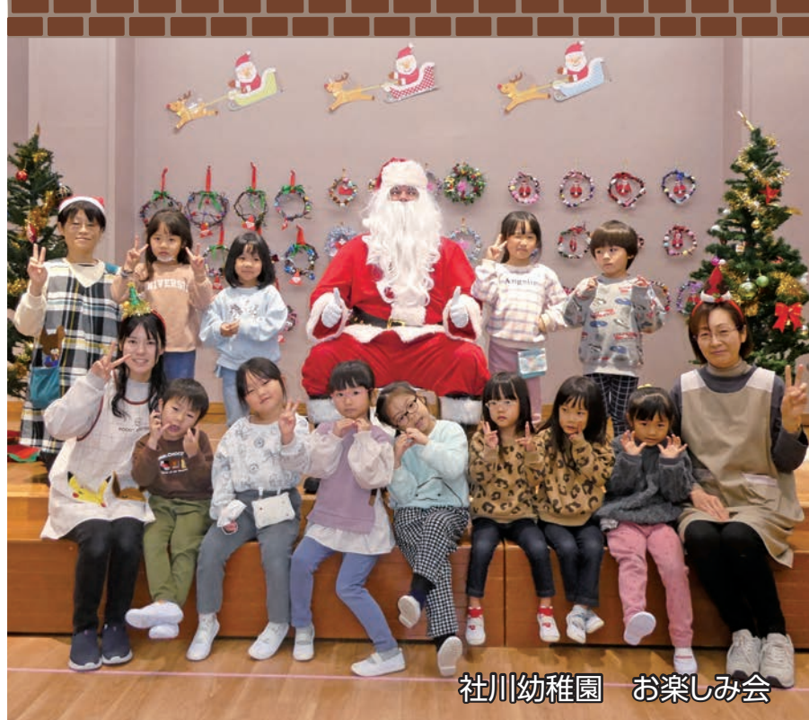
社川幼稚園 お楽しみ会