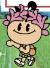
棚倉町シンボルキャラクター たなちゃん