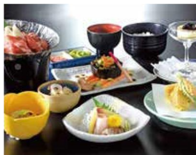
シーズンプランのご夕食イメージ