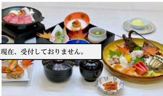
ちょっと贅沢プランのご夕食イメージ