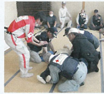
ボランティアの育成