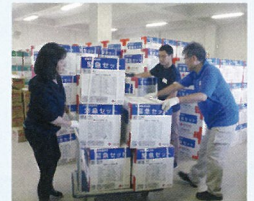
ボランティアと共に必要な物資を準備