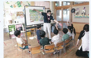
子どもたちへの防災教育

青少年赤十字 (JRC) は「気づき・考え・実行する」を態度目標に、思いやりや優しさ、主体性を育むことを目的として学校教育に取り入れられています。福島県ではほぼすべての小中学校が加盟しています。