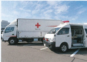
医療救護班や救援物資は、陸・海・空、様々な手段で被災地へ