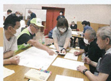
地域防災力の向上

地域の自助・共助の力を高めるため、命を守る知識と技術を伝える救急法や防災セミナーを実施しています