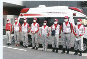
全国の赤十字が連携し、被災地へ向けて職員を派遣します