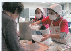
奉仕団による炊き出し